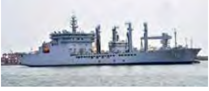
ஓட்சிசனை ஏற்றிக்கொண்டு புறப்பட்ட இலங்கை கடற்படை கப்பலான சக்தி, நாட்டை நெருங்குகிறது என்று கடற்படை செய்தி தொடர்பாளர் கப்டன் இந்திகா டி. சில்வா நேற்று மாலை கூறியிருந்தார். (ஐ)

கொழும்பு, ஓக. 23 ஓட்சிசனை ஏற்றியபடி வந்த இந்திய கடற்படை கப்பலான சக்தி, நேற்று பிற்பகல் கொழும்பு துறைமுகத்தை வந்தடைந்தது. இந்தியாவின் விசாகப்பட்டினம் துறைமுகத்தில் இருந்து, 39 தொன் ஓட்சிசனுடன் இந்தக் கப்பல் கடந்த 19ஆம் திகதி பயணத்தை தொடங்கியிருந்தது. இதேவேளை, சென்னை துறைமுகத்தில் 39 தொன் ஓட்சிசனை ஏற்றிக்கொண்டு புறப்பட்ட இலங்கை கடற்படை கப்பலான சக்தி, நாட்டை நெருங்குகிறது என்று கடற்படை செய்தி தொடர்பாளர் கப்டன் இந்திகா டி. சில்வா நேற்று மாலை கூறியிருந்தார். (ஐ)