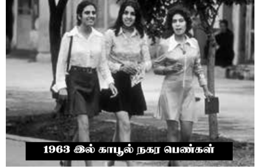
1963 இல் காபூல் நகர பெண்கள்