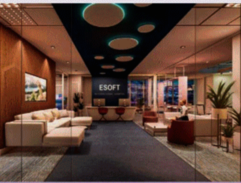
One Galle Face (Shangri-La) Business Tower இல் இவற்றின் ESOFT இன்டர்நேஷனல் கம்பஸ் வளாகம்

புத்தாக்கமான மற்றும் நவீன கல்வித் தீர்வுகளை உள்நாட்டு மற்றும் வெளிநாட்டு மாணவர்களுக்கு வழங்குவதில் முன்னோடியாகத் திகழும் ESOFT குழுவும், தனது நவீன வசதிகள் படைத்த ESOFT இன்டர்நேஷனல் கம்பஸ் (EIC) வளாகத்தை 2021 செப்டெம்பர் மாதத்தில் One Galle Face (Shangri-La) Business Tower இல் நிறுவத் திட்டமிட்டுள்ளது.