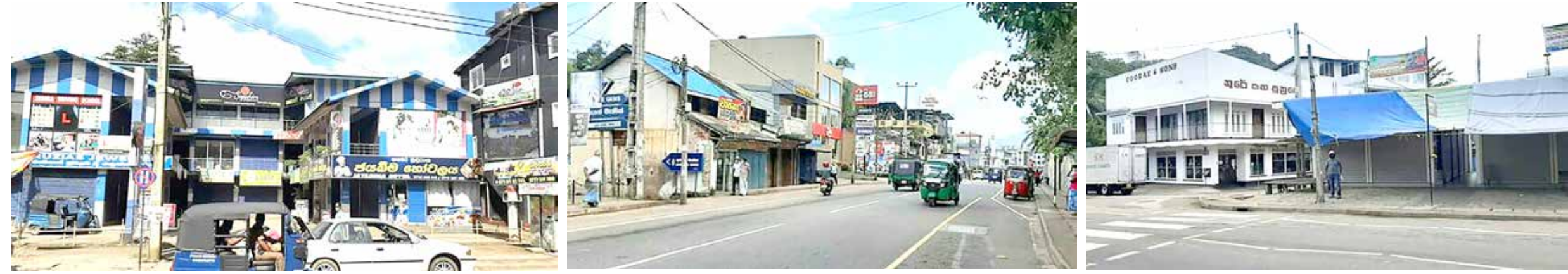
கொரோனா தொற்றுப் பரவல் அதிகரித்துள்ளதனால் காவத்தை நகரிலுள்ள அத்தியாவசிய வர்த்தக நிலையங்களைத் தவிர, ஏனைய சகல வர்த்தக நிலையங்களும் நேற்று மூடப்பட்டிருந்ததை படங்களில் காணலாம்.