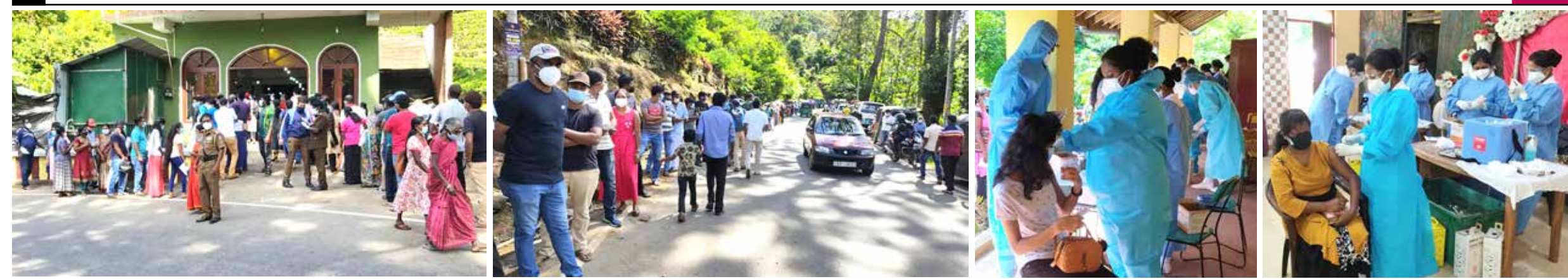
மல்கெலியா பொதுச் சுகாதார வைத்திய அதிகாரி காரியாலயத்துக்குட்பட்ட பகுதிகளிலுள்ள ஐயாயிரத்து 600 பேருக்கு இரண்டாம் கட்ட தடுப்பூசி ஏற்றப்பட்டது. இதன்போது 30 வயதுக்கு மேற்பட்டோருக்கு தடுப்பூசி ஏற்றும் நடவடிக்கையில் பெருமளவானோர் கலந்துகொண்டு தடுப்பூசி பெற்றுக்கொண்டமை குறிப்பிடத்தக்கது.