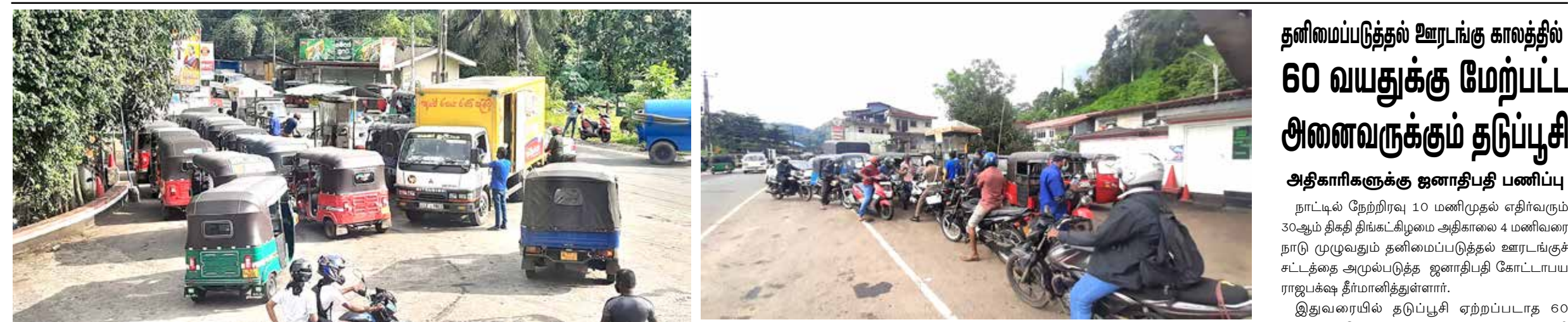
கேகலை, எட்டியாந்தோட்டை நகரில் பெற்றோல், டீசல் பெற்றுக்கொள்வதற்காக பொதுமக்கள் தங்கள் வாகனங்களுடன் நேற்று நீண்ட வரிசையில் பல மணிநேரம் காத்திருந்தனர். இதனால் வாகன நெரிசல் அதிகரித்துக் காணப்பட்டமை குறிப்பிடத்தக்கது.