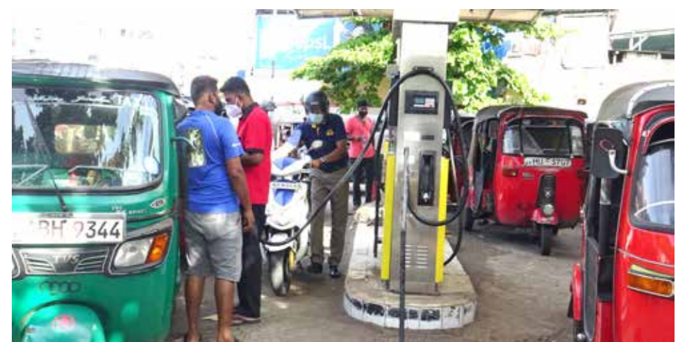
ஊரடங்குச் சட்டம் அமுல்படுத்தப்பட்டுள்ள நிலையில், கொழும்பிலுள்ள வர்த்தக நிலையங்கள், அங்காடிகள் மற்றும் எரிபொருள் நிரப்பு நிலையங்களில் மக்கள் முண்டியடித்துக்கொண்டு நீண்ட வரிசைகளில் நின்று நேற்று மாலை பொருட்களைக் கொள்வனவு செய்வதற்குக் காணமுடிந்தது.