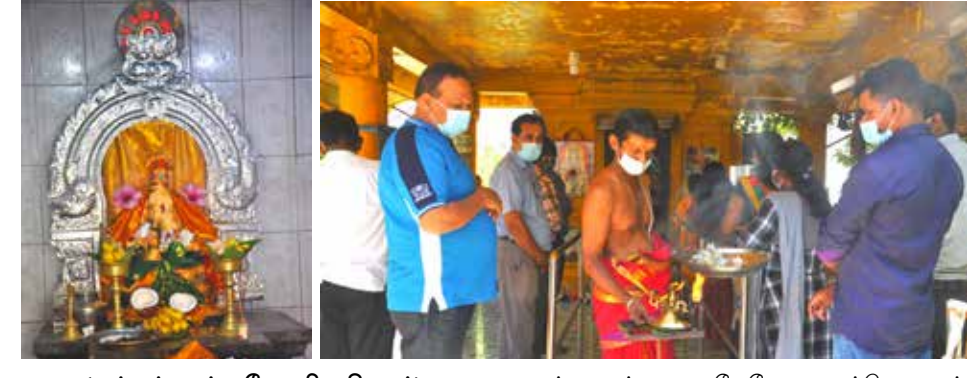
(மட்டக்களப்பு மேலதிக நிருபர்)

மட்டக்களப்பு மாவட்ட செயலக ஸ்ரீ சித்தி விநாயகர் ஆலயத்தின் விசேட வரலட்சுமி பூஜை நிகழ்வு நேற்று வெள்ளிக்கிழமை நடைபெற்றுள்ளது.