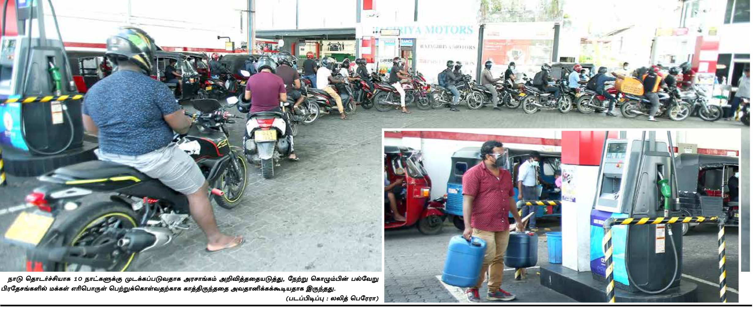
நாடு தொடர்ச்சியாக 10 நாட்களுக்கு முடக்கப்படுவதாக அரசாங்கம் அறிவித்ததையடுத்து, நேற்று கொழும்பின் பல்வேறு பிரதேசங்களில் மக்கள் எரிபொருள் பெற்றுக்கொள்வதற்காக காத்திருந்ததை அவதானிக்கக்கூடியதாக இருந்தது.