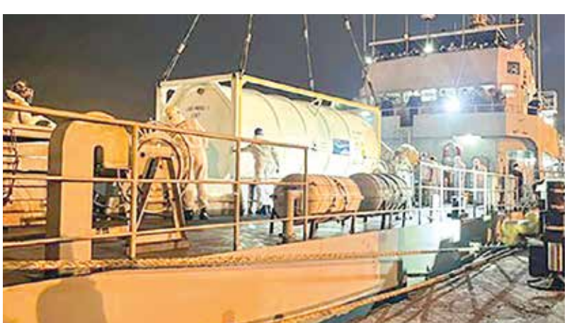
இந்தியாவிடமிருந்து கொள்வனவு செய்யப்பட்ட மருத்துவ ஓட்சிசன் தொகையை நாட்டுக்கு கொண்டுவருவதற்காக திருகோணமலை துறைமுகத்திலிருந்து புறப்பட்ட 'சக்தி' கப்பல், ஓட்சிசன் கொள்வனவுகளை ஏற்றிக்கொண்டு நேற்றுக் காலை சென்னை துறைமுகத்திலிருந்து இலங்கை நோக்கி புறப்பட்டுள்ளது.

•எம்.கிருஷ்ணா டிக் கோயா ஆதார வைத்தியசாலையில் கடமையாற்றும் நான்கு வைத்தியர்கள் உட்பட 17 பேருக்கு கொரோனா தொற்று உறுதிசெய்யப்பட்டுள்ளது. வைத்தியசாலை ஊழியர்கள் 07 பேர், தாழியர்கள் 06 பேர் மற்றும் வைத்தியர்கள் நால்வருமாக 17 பேருக்கே இவ்வாறு கொரோனா தொற்று உறுதியாகியுள்ளதாக பொதுச் சுகாதார அதிகாரிகள் தெரிவித்தனர். மேலும், வைத்தியசாலையில் கொரோனா தொற்று நோயாளர் பிரிவில் அதிக எண்ணிக்கையிலானோர் சிகிச்சைபெற்று வருவதுடன், வைத்திய சேவை நடவடிக்கைகளும் பாதிக்கப்பட்டுள்ளதாக அதிகாரிகள் தெரிவித்தனர். இவ்வாறு தொற்றுக்குள்ளான 17 பேரையும் கொரோனா சிகிச்சை மத்திய நிலையங்களுக்கு அனுப்பிவைக்கப்பட்டுள்ளதாகவும் இவர்களோடு தொடர்பைப் பேணியவர்களை சுயதனிமைப்படுத்த நடவடிக்கை எடுக்கப்பட்டுள்ளதாகவும் பொதுச் சுகாதார அதிகாரிகள் தெரிவித்தனர்.