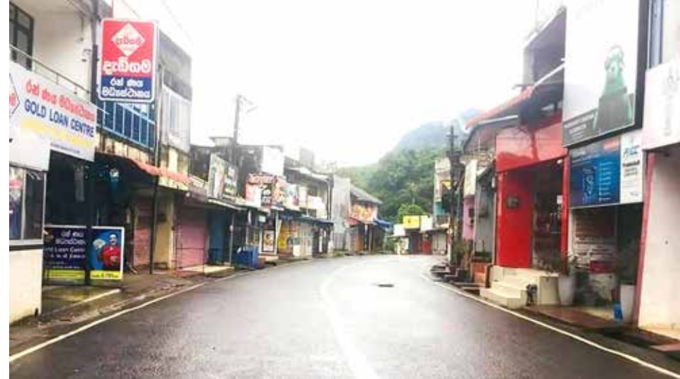
கொரோனா தொற்றுப் பரவல் அதிகரித்துள்ளதனால் இறக்குவானை நகரிலுள்ள அத்தியாவசிய வர்த்தக நிலையங்களைத் தவிர, ஏனைய சகல வர்த்தக நிலையங்களும் நேற்று மூடப்பட்டிருந்தன.

நாட்டை முடக்குவதற்கு ஜனாதிபதி தீர்மானித்தால் சுகாதாரத்துறையினர், பாதுகாப்புத்துறை உள்ளிட்டு கொரோனா கட்டுப்பாட்டுக்காக செயற்படும் துறைகளை அடையாளங்கண்டு, ஏனைய துறையினர் சம்பளத்தில் குறைவாகும் தனியாகும் தியாகம் செய்து பொருளாதாரத்திற்கு ஒத்துழைப்பு வழங்குமாறு அமைச்சர் பிரச்சன ரணதுங்க தெரிவித்துள்ளார். நாடு முடக்கப்பட்டிருந்தால் நான் உள்ளிட்ட நாடாளுமன்ற உறுப்பினர்களின் சம்பளத்தில் 75 சதவீத தொகையும், அரச மற்றும் தனியார்களுக்கான ஊழியர்களின் சம்பளத்தில் 50 சதவீதமும், சிறு தொழிலாளர்களிடமிருந்து 30 சதவீதமும் செய்யுமாறு தான் யோசனையொன்றை முன்வைப்பதாக அவர் தெரிவித்துள்ளார்.