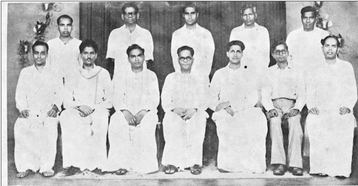
தமிழ்மறைக் கழக ஆட்சி மன்ற உறுப்பினர்—1955.