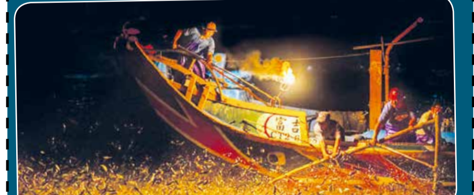
தாய்வான் வாவிகளில் அநேகமாக இரவு நேரங்களில் மீன்பிடிப்பது வழமையாகும். அங்கு மீன்களைக் கவர்வதற்கு நெருப்பின் வெளிச்சம் பயன்படுத்தப்படுகிறது.