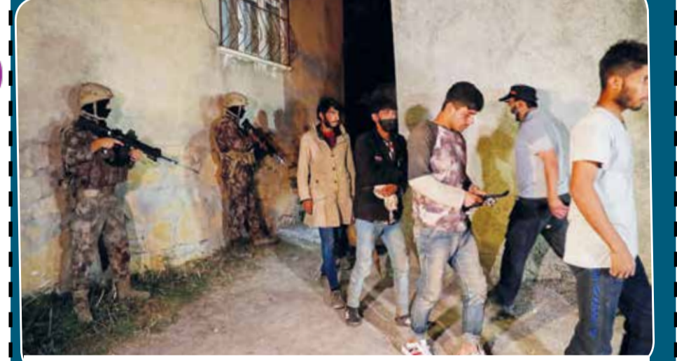
ஆப்கானிஸ்தானிலிருந்து துருக்கிக்கு தப்பிச் சென்றுள்ள அகதிகள் பலத்த பாதுகாப்புடன் தங்குமிடங்களுக்கு அனுப்பிவைக்கப்படுகின்றனர்.