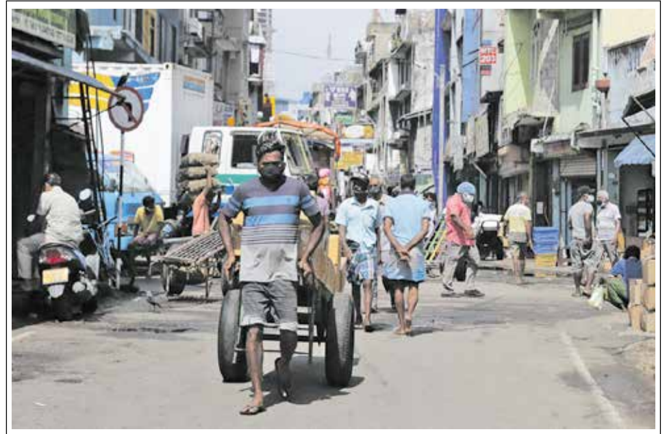
புறக்கோட்டை நான்காம் குறுக்குத்தெருவில் நேற்று (25) வழமைபோல் மொத்த விற்பனை நடவடிக்கைகள் இடம்பெற்றன.

● யோ.தர்மராஜ் நாடளாவிய ரீதியிலுள்ள வைத்தியசாலைகளில் பணியாற்றும் அனைத்து சுகாதாரப் பிரிவினருக்கும் அன்றிஜன் பரிசோதனை முன்னெடுக்கப்பட்டால் அவர்களில் நான்கில் ஒருவருக்கு கொரோனா தொற்று உறுதிசெய்யப்படும் என அகில இலங்கை தாதிமார் சங்கத்தின் பொதுச் செயலாளர்... 02>>