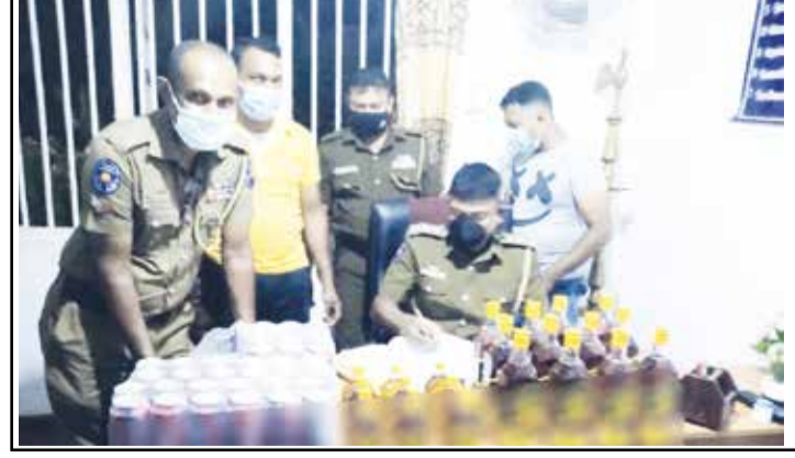
(பலாங்கொடை) நாடு முழுவதும் தனிமைப் படுத்தல் ஊரடங்குச் சட்டம் அமுல் படுத்தப்பட்டுள்ள நிலையில், அதிக விலையில் விற்பனை செய்வதற்காக கொண்டுசெல்லப்பட்ட மதுபான போத்தல்களுடன் ஒருவரை நேற்று முன்தினம் பலாங்கொடை பொலிஸ் நிலைய அதிகாரியால் கைதுசெய்யப்பட்டுள்ளார். பொலிஸ் நிலைய அதிகாரிகளுக்கு கிடைத்த இரகசிய தகவலுக்கமைய

பொலிஸ் அதிகாரிகள் பலாங்கொடை நகரத்திலுள்ள வியாபார நிலையம் ஒன்றை சோதனையிட்டபோது வியாபார நிலையமொன்றில் மேல் மாடியில் மறைத்துவைத்திருந்த மதுபான போத்தல்களுடன் ஒருவரை கைதுசெய்துள்ளார்கள். 750 மில்லிநீற்றர் சாராயப் போத்தல்கள் 12, 180 மில்லி வீற்றர் சாராயப் போத்தல்கள் 13, பியர் போத்தல்கள் 37 என்பன சந்தேகநபரிடமிருந்து கைப்பற்றப்பட்டுள்ளன.