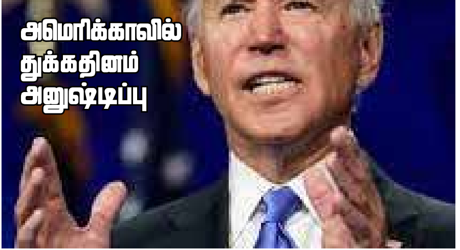
அமெரிக்காவில் துக்கதினம் அனுஷ்டிப்பு

ஆப்கானிஸ்தானின் காபூலில் பயங்கரவாத தாக்குதலில் உயிரிழந்தவர்களை நினைவுகூரும் வகையில் ஓகஸ்ட் 30 மாலை வரை வெள்ளை மானிகை மற்றும் அனைத்து பொதுக் கட்டிடங்கள், மைதானங்களில் அமெரிக்கக் கொடி அரைக்கம்பத்தில் பறக்கப்படும் என்று வெள்ளை மானிகை செய்தித் தொடர்பாளர் ஜென் சாகி கூறினார்.