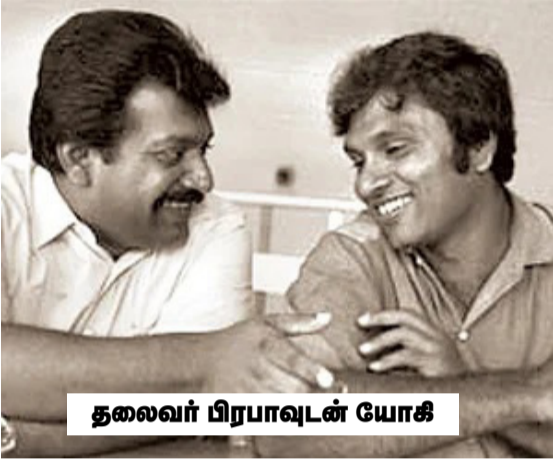
தலைவர் பிரபாவுடன் யோகி

1985இல் எனது தமிழகப் பயணத்தின் போதும் திருச்சி போய் இறங்கி, அங்கிருந்து உடனே மதுரை சென்றதாக நினைவு. மதுரை விடயங்களை முடித்துக் கொண்டு மீண்டும் திருச்சி வழியாக சென்னை சென்றேன். எங்கே தங்கினேன் என்பது பற்றிய சரியான நினைவு எனக்கில்லை. ஆனால் நான்கு, ஐந்து நாள் களுக்கு மேல் ஒரே பிஸி. பெரும்பாலும் தமிழ் இயக்கங்களின் வெவ்வேறு அலுவலகங்களில்தான் நேரம் போனது.