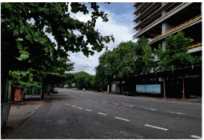
தெரிவித்துள்ளனர். இவ்வாறு நாட்டை முடக்குவதன் மூலம் பொதுமக்களின் பாதுகாப்பிற்காக தடுப்பூசி செலுத்தும் நடவடிக்கைகளை சிறப்பாக

கொரோனா வைரஸ் உயிரிழப்புகளை குறைக்க, நாட்டை ஒக்ஸ்டோபர் இரண்டாம் திகதி வரை அல்லது செப்டம்பர் 18 ஆம் திகதி வரை முடக்கினால் 7,500 முதல் 10,000 ஆயிரம் உயிர்களை காப்பாற்ற முடியுமென