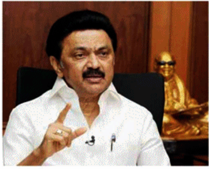
மாநில அரசாங்கத்தின் கட்டுப் பாட்டில் இருக்கும் ஒரு துறைக்கு, மாநில அரசாங்கங்களுடன் ஆலோசனை நடத்தாமல், தன்னிச்சையாக மத்திய அரசாங்கம் சட்டம் இயற்றியிருப்பது, கூட்டாட்சி தத்துவத்துக்கு விரோதமானது. அதனால் தான், அந்தச் சட்டங்களை நிராகரிக்க வேண்டியதாக இருக்கிறது. மூன்று சட்டங்களுமே வேளாண்மைக்கு எதிரானதாகவும், விவசாயிகள் மற்றும் நுகர்வோருக்கு பாதுகாப்புமற்றதாகவும் அமைந்திருக்கின்றன.

மத்திய அரசாங்கம் கொண்டு வந்துள்ள மூன்று வேளாண் சட்டங்களை எதிர்த்து, சட்டசபையில் தீர்மானம் நிறைவேற்றப்பட்டது. அதற்கு ஆதரவு தெரிவித்து பாட்டாளி மக்கள் கட்சி பேசிய நிலையில், அண்ணா திராவிட முன்னேற்ற கழகம் (அ.தி.மு.க.) மற்றும் பாரதிய ஜனதா (பா.ஜ.) - எம்.எல்.ஏ.க்கள் வெளிநடப்பு செய்தனர். சட்டசபையில் நேற்றுமுன்தினம், மத்திய அரசாங்கத்தின் மூன்று வேளாண் சட்டங்களை ரத்து செய்யக் கோரும் அரசினர் தனி தீர்மானத்தை, முதலமைச்சர் ஸ்டாலின் முன்மொழிந்து, அவர் பேசியதாவது: மத்திய பா.ஜ., அரசாங்கத்தின் மூன்று வேளாண் சட்டங்களை ரத்து செய்ய வேண்டும் என்ற தீர்மானத்தை நிறைவேற்றப் போகிறோம். இத்தகைய நெருக்கடியான சூழலை, மத்திய அரசாங்கத்தின் உருவாக்கியுள்ளது. வேளாண்மையை மேம்படுத்தவும், விவசாயிகளைக் காப்பாற்றவும், மத்திய அரசாங்கத்தால் கொண்டு வரப்பட்டதாக சொல்லப்படும் மூன்று வேளாண் சட்டங்களும், அந்த நோக்கத்தை நிறைவேற்றுவதாக இல்லை; வேளாண்மையை அழிப்பதாக இருக்கிறது' என, விவசாயிகள் சொல்கின்றனர். இத்தகைய சூழலில், மூன்று வேளாண் சட்டங்களையும் முழுமையாக எதிர்க்க வேண்டிய கடமை நமக்கு இருக்கிறது.