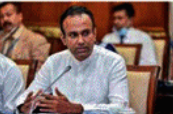
தீர்மானம் எடுக்கப்படும் என்றார். பலப்பிடிய வைத்தியசாலையில் கண்காணிப்பு நடவடிக்கையில் ஈடுபட்டதன் பின்னர் ஊடகங்களுக்கு மேற்கண்டவாறு தெரிவித்தார். தொடர்ந்து தெரிவித்த

கொவிட் என்பது சாதாரண நோய் அல்ல. ஆகையால், அதிக அவதானத்துடன் செயற்பட வேண்டும் என தெரிவித்துள்ள பெருந்தொட்டத்துறை அமைச்சர் ரமேஷ் பத்திரண, கொவிட் வைரஸ் தொற்றாளர்களின் எண்ணிக்கை மற்றும் பதிவாகும் மரணங்களின் எண்ணிக்கை ஆகியவற்றை கருத்திற் கொண்டு ஊரடங்கு சட்டத்தை தொடர்ந்து அமுல்படுத்துவதா அல்லது தளர்த்துவதா என்ற