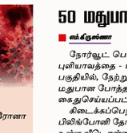
செய்யப்படுவதாகவும், பொலிஸாரின் ஆரம்பகட்ட விசாரணைகளில் இருந்து தெரியவந்துள்ளது. கைது செய்யப்பட்ட சந்தேக நபருக்கு எதிராக வழக்கு பதிவு செய்து, ஹட்டன் மாவட்ட நீதவான் நீதிமன்றில் ஆஜர்படுத்த நடவடிக்கை எடுத்துள்ளதாக, நோர்வூட் பொலிஸார் தெரிவித்தனர்.

நோர்வூட் பொலிஸ் பிரிவுக்குட்பட்ட புளியாவத்தை - பிலிப்போனி தோட்டப் பகுதியில், நேற்று முன்தினம் (28), 50 மதுபான போத்தல்களுடன் ஓடுவர் கைதுசெய்யப்பட்டுள்ளார். கிடைக்கப்பெற்ற தகவலையடுத்து, பிலிப்போனி தோட்டப் பகுதியில் உள்ள வீடொன்றை சுற்றவளைத்து சோதனை செய்த போதே, குறித்த பர், 50 மதுபான போத்தல்களுடன் கைதுசெய்யப்பட்டுள்ளார். ஊராட்சி சட்டம் அமுல்படுத்தப்பட்டுள்ள வேளையில், தோட்டப் பகுதியில், அதிக விலையில் விற்பனை செய்வதற்காக பதுக்கி வைக்கப்பட்டிருந்ததாகவும் ஒரு மதுபான போத்தல் 3,500 ரூபாய்க்கு விற்பனை