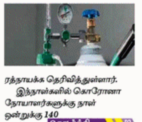
ரத்தநாயக்க தெரிவித்துள்ளார். இந்நாள்களில் கொரோனா நோயாளர்களுக்கு நான் ஒன்றுக்கு 140 தொடர்ச்சி

கொரோனா தொற்றாளர்களுக்கு வழங்குவதற்காக வாராந்தம் 300 தொன் ஒக்சிசனை இந்தியாவிலிருந்து கொண்டு வருவதற்கு தீர்மானித்துள்ளதாக ஒளடத உற்பத்திகள், வழங்கல் மற்றும் ஒழுங்குபடுத்தல் இராஜாங்க அமைச்சின் செயலாளர், வைத்தியர் சமன்