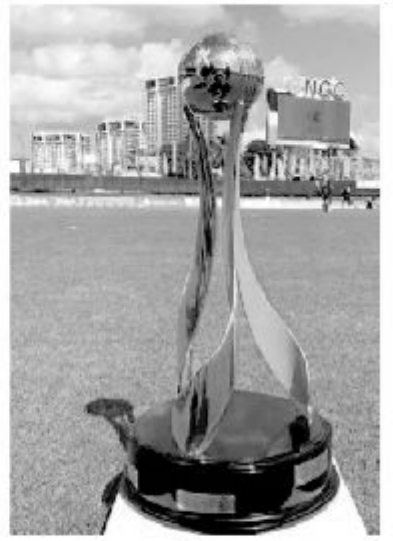
முடிந்தது. இதனால் சென்.கிட்ஸ்- நெவின் பெட்ரியோட்ஸ் அணி 21 ஓட்டங்களால் வெற்றிபெற்றது. (4-6)

கரீபியன் பிறீமியர் லீக் கிரிகெட் -20 தொடரின் ஆரம்ப போட்டிகளில் கயானா அமசோன் அணி மற்றும் சென்.கிட்ஸ் நெவின் பெட்ரியோட்ஸ் அணிகள் வெற்றி பெற்றுள்ளன.