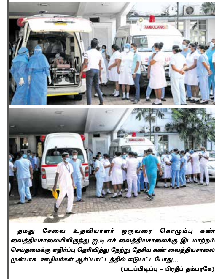
தமது சேவை உதவியாளர் ஒருவரை கொழும்பு கண் வைத்தியசாலையிலிருந்து ஐ.டி.எச் வைத்தியசாலைக்கு இடமாற்றம் செய்தமைக்கு எதிர்ப்பு தெரிவித்து நேற்று தேசிய கண் வைத்தியசாலை முன்பாக ஊழியர்கள் ஆர்ப்பாட்டத்தில் ஈடுபட்டபோது...

யுத்த காலத்தில் இலங்கை அரசாங்கத்தின் முப்படைகளாலும் கடத்தப்பட்ட, கையளிக்கப்பட்ட உறவுகளின் நீதியை வலியுறுத்தி நேற்று முன்தினம் இரவு மன்னார் வலிந்து காணாமலாக்கப்பட்ட உறவுகளோடு இணைந்து மன்னார் பாதிக்கப்பட்ட குடும்பங்களுக்கான இணையத்தின் ஏற்பாட்டில் தீபம் ஏற்றி கவனயீர்ப்பு முன்னெடுக்கப்பட்டது. முடக்க நிலை காரணமாக வீடுகளில் வலிந்து காணாமல் ஆக்கப்பட்ட உறவுகளுக்கு நீதி வேண்டியும் காணாமல் ஆக்கப்பட்ட தங்கள் உறவுகளுக்கு விரைவில் அரசாங்கம் பதிலளிக்க வேண்டுமென கோரியும் வீடுகளில் தீபமேற்றி காணாமலாக்கப்பட்ட உறவுகளின் குடும்பத்தினர் கவனயீர்ப்பு நிகழ்வுகளை முன்னெடுத்தனர். அதேநேரம், காணாமலாக்கப்பட்டோர் விடயத்தில் சர்வதேசம் தலையிட்டு யுத்த காலப்பகுதியிலும் அதற்கு முன்னரும் இலங்கை அரசாங்கத்தினால் கடத்தப்பட்ட மற்றும் சரணடைந்த தங்கள் உறவுகளுக்கு நியாயத்தை பெற்றுதர வேண்டும் என கோரிக்கை விடுத்துள்ளனர்.