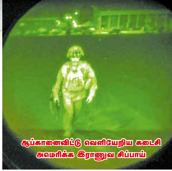
ஆப்கானைவிட்டு வெளியேறிய கடைசி அமெரிக்க இராணுவ சிப்பாய்