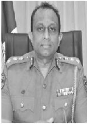
இது தொடர்பில் அவர் மேலும் தெரிவிக்கையில்,