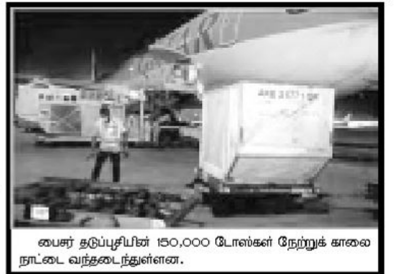
பைசர் தடுப்பூசியின் 150,000 டோஸ்கள் நேற்றுக் காலை நாட்டை வந்தடைந்துள்ளன.

தினம் இடம்பெற்ற ஊடகவியலாளர் சந்திப்பில் வைத்து அவர் இதனை குறிப்பிட்டுள்ளார். கண்டி வைத்தியசாலையில் மாத்திரம் 250 சுகாதார பணியாளர்களுக்கு கொவிட்-19 தொற்றுறுதியானதாக அவர் சுட்டிக்காட்டியுள்ளார். (நி-5)