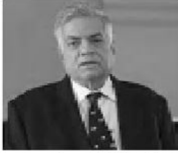
சுகாதார ஸ்தாபனம் கோரிக்கை விடுத்துள்ளமையும் இதன்

மேலும் கொரோனா தொற்றினை கட்டுப்படுத்த நிபுணர்கள் குழுவை நியமிக்கும்மாறு உலக