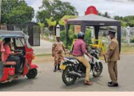
பயணிகளுக்கு மாத்திரம் பயணிக்க அனுமதியளிக்கப்பட்டதுடன் தேவையற்ற விதத்தில் பயணித்தவர்கள் எச்சரிக்கையுடன் வீடுகளுக்கு திருப்பி அனுப்பப்பட்டதும் குறிப்பிடத்தக்கது.

திருகோணமலை ரவீக் பாயில் நாடு முழுவதும் ஊரடங்கு சட்டம் அமல்படுத்தப்பட்டுள்ள நிலையில் திருகோணமலை நகரில் மக்கள் நடமாட்டம் அதிகமாக இருப்பதாக பொலிசார் தெரிவிக்கின்றனர். திருகோணமலையில் அரச மற்றும் தனியார் வங்கிகள் அரச நிறுவனங்கள் வழமைபோல் இயங்குவதுடன் நகரில் அநேகமான வர்த்தக நிலையங்கள் மூடப்பட்டு இருப்பதை எம்மால் அவதானிக்க முடிந்ததுடன் நகரில் மக்கள் நடமாட்டம் அதிகரித்து காணப்படுவதை எம்மால் காணக்கூடியதாக இருந்தது. இவ்வாறு பொதுமக்களின் தேவையற்ற நடமாட்டத்தை கட்டுப்படுத்த திருகோணமலை தலைமையக பொலிஸார் மற்றும் உப்பு வெளி பொலிஸார் இணைந்து வீதியில் விசேட சோதனை நடவடிக்கை ஒன்றை மேற்கொண்டிருந்தனர். இவ் சோதனை நடவடிக்கையில் அனுமதி பத்திரங்களுடன் பயணிக்கும் பயணிகள் மற்றும் வாகனங்களுக்கு அனுமதிக்கப்பட்டதுடன் அத்தியாவசிய தேவை மற்றும் வைத்தியசாலை செல்லும்