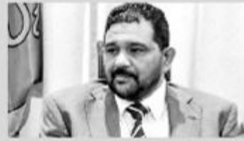
முமை உத்தரவு பிறப்பித்துள்ளது. (நி-5)

முன்னாள் ஆளுநர் அசாத் சாலியை செப்டம்பர் மாதம் 14 ஆம் திகதி வரை தொடர்ந்தும் விளக்கமறியலில் வைக்கும்படி கொழும்பு நீதிமன்றம் நேற்று செவ்வாய்க்கி