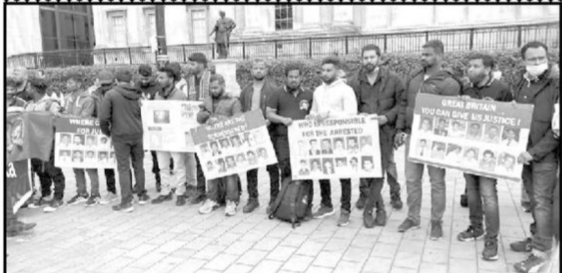
வலிந்து காணாமல் ஆக்கப்பட்டவர்களுக்கான அனைத்துலக நாளைவொட்டி நாடுகடத்த தமிழீழ அரசாங்கத்தின் ஏற்பாட்டில் தேற்றைவதினம் அதன் ஆதரவாளர்களால் காணாமல் ஆக்கப்பட்டோருக்கு தீதிகோரி கவனவீர்ப்புப் போராட்டமொன்று லண்டன் மாநகரில் நடைபெற்றது.

லஹிரு மதுஷங்க, மகேஷ் தீக்ஷண மற்றும் புலின தரங்க ஆகியோர் இலங்கை அணியில் புதுமுக வீரர்களாக களமிறங்கவுள்ளனர். தசன் ஷனகா தலைமையிலான அணியில், தனஞ்சய டி சிவ்வா, சுகல் பெரேரா, தினேஷ் சந்திமல், அவிஷ்க பெர்னாண்டோ, பாணுக ராஜபக்ஷ, பத்தும் நிசங்க, சரித அசுவங்க, வனிந்து ஹசாரங்க, கமிந்து மெண்டிஸ், மீனோத் பாணுக, ரமேஷ் மெண்டிஸ், சாமிக் கருணாரத்ன, நுவான் பிரதீப், பினூர பெர்னாண்டோ, துஷ்மந்த சுமீர், அகில தனஞ்சய, பிரவீன் ஜெயவிரம, ஹெரி குமார, ஹெரி மதுஷங்க, புலின தரங்க, மகேஷ் தீக்ஷண ஆகியோர் இடம் பெற்றுள்ளனர். (4)