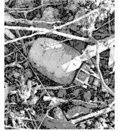
நடவடிக்கை எடுத்துள்ளதாக தெரிவிக்கின்றனர். சம்பவம் தொடர்பில் நீதிமன்றில் அனுமதிவற்பட்டு விசேட அதிரடிப்படையினர் மூலம் அவற்றை பாதுகாப்பான முறையில் அகற்றியெய்மூக்கச் செய்ய நடவடிக்கை எடுக்கப்பட்டுள்ளதாக பொலிஸார் குறிப்பிடுகின்றனர். (ம-03, 100)

(முறுகண்டி) கிளிநொச்சி வன்னேரிக்குளம் பகுதியில் 7 கைக்குண்டுகள் அடையாளம் காணப்பட்டன. அக்கரையின் பொலிஸ் பிரிவுற் குட்பட்ட வன்னேரிக்குளம் பகுதியில் வயல் நிலத்தை பண்படுத்திக் கொண்டிருந்த நிலையில் நேற்றுப் பகல் குறித்த கைக்குண்டுகள் அடையாளம் காணப்பட்டுள்ளன. குறித்த விடயம் தொடர்பில் காணியூர்மையாளரால் அருகில் உள்ள இராணுவத்தினருக்கு தகவல் வழங்கப்பட்டுள்ளது. தொடர்ந்து இராணுவத்தினரால் பொலிஸாருக்கு தகவல் வழங்கப்பட்டதை அடுத்து பொலிஸார் விசாரணை மேற்கொண்டனர். குறித்த கைக்குண்டுகளை பாதுகாப்பாக அடையாளப்படுத்திய பொலிஸார், அவற்றை அகற்ற