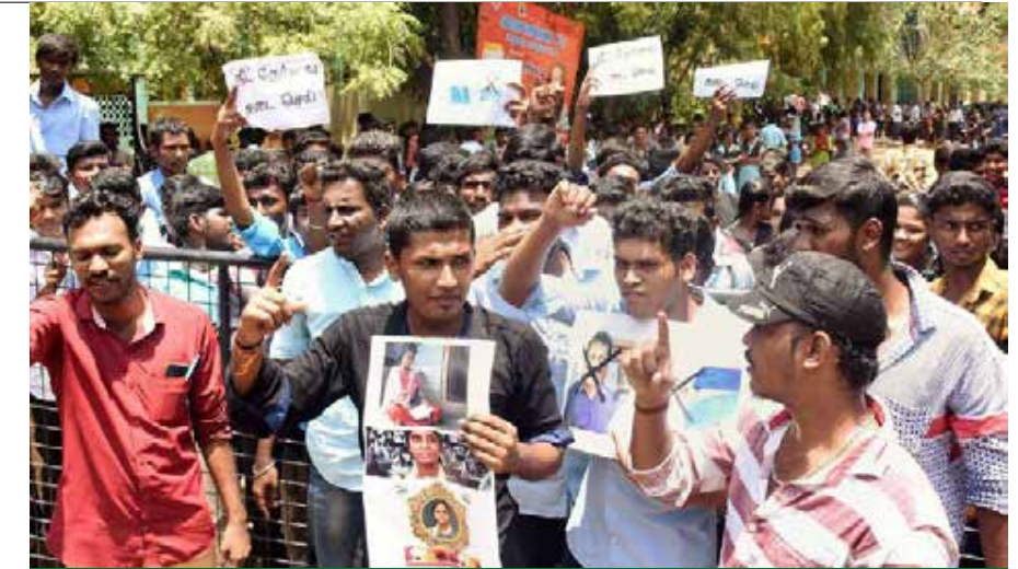
மருத்துவக் குறைக்கான நீட் தேர்வைத் தவிர்ப்பதற்கு புதிய சட்டம் குடியரசுத் தலைவரின் ஒப்புதலைப் பெற தமிழக அரசு நடவடிக்கை

பொய்ச் சான்றிதழ் அளித்தால், சம்பந்தப்பட்டவர்கள் மீது நீதிமன்ற அவமதிப்பு உள்ளிட்ட நடவடிக்கைகளை எடுக்கலாம் என நீதிபதிகள் உத்தரவிட்டனர். நாட்டு மாடுகள் இனப்பெருக்கத்துக்கு உணக்கம் அளிக்க அரசுக்கு ஆலோசனை வழங்கிய நீதிபதிகள், மாடுகளுக்கு செயற்கைக் கருத்தரித்தல் முறையை தவிர்க்க வேண்டும் எனவும் அறிவுறுத்தியுள்ளனர்.