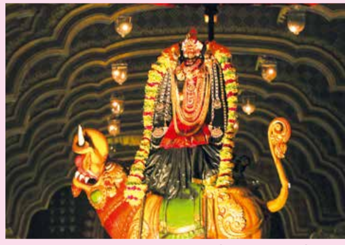
யாழ்ப்பாணம் நல்லூர் கந்தசுவாமி ஆலய கஜவல்லிமஹாவல்லி உற்சவம் நேற்று மிகவும் பக்தி பூர்வமாக இடம்பெற்றது.

மக்களின் நடமாட்டங்களை கட்டுப்படுத்த முடியாதநிலை காணப்படுகின்றது. மன்னார் மாவட்டத்தில் கடந்த மாதம் கொரோனா தொற்று மற்றும் மரணங்கள் சடுதியாக அதிகரித்துள்ள நிலையில் மக்கள் தொடர்ந்து ஊரடங்கு நிலையை மதிக்காது செயற்படுவதுடன் அனுமதி பெறாத பல வர்த்தக நிலையங்கள் மற்றும் மரக்கறி வியாபார நிலையங்கள் மக்களை அதிகளவில் ஒன்று கூட்டி விற்பனை நடவடிக்கையிலும் ஈடுபட்டு வருகின்றனர். அதேநேரம் மன்னாரில் பல இடங்களின் உரிய அனுமதியின்றி திருமண நிகழ்வுகள் மற்றும் களியாட்ட நிகழ்வுகள் இடம் பெறுவதையும் அவதானிக்கக் கூடியதாக உள்ளது.