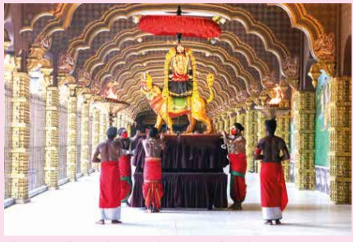
யாழ்ப்பாணம் நல்லூர் கந்தசுவாமி ஆலய கஜவல்லிமஹாவல்லி உற்சவம் நேற்று மிகவும் பக்தி பூர்வமாக இடம்பெற்றது.