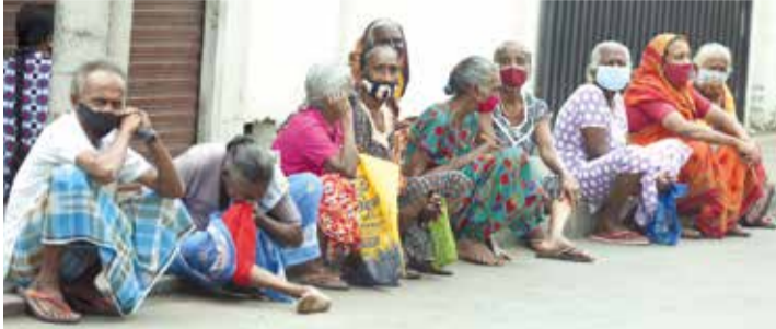
முதியவர்களுக்கு நிவாரணத்தொகை வழங்கும் வேலைத்திட்டம் நேற்று கொழும்பின் பல பிரதேசங்களில் இடம்பெற்றது.