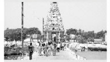
(யாழ்ப்பாணம்) யாழ்ப்பாணம் 15

மாந்தை கிழக்கில் குடும்பஸ்தரின் சடலம் மீட்பு