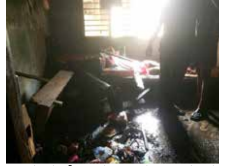
அவர்கள் தீயைக் கட்டுப்பாட்டுக்குள் கொண்டு வந்தனர்.

சம்பவம் தொடர்பில் யாழ்ப்பாணம் மாநகர தீயணைப்புப் படைக்கு அறிவிக்கப்பட்ட நிலையில் அங்கு விரைந்த