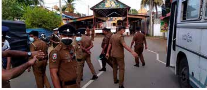
(எஸ்.நீதர்ஷன், இ.கலையமுதன்) வரலாற்றுப் பிரசித்தி பெற்ற நல்லூர் முருகன் ஆலய வருடாந்த மகோற்சவத்தின் தேர் உற்சவம் இன்று ஆலய உள்வீதியில் இடம்பெற்ற நிலையில் ஆலயச் சூழலில் பெருமளவு