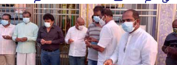
கொரோனாவால் மரணித்த அனைத்து இலங்கையர்களுக்கும் அஞ்சலி செலுத்தும் நிகழ்வு தமிழ் முற்போக்குக் கூட்டணியினதும் ஜனநாயக மக்கள் முன்னணியினதும் தலைவர் மனோ கணேசன் எம்.பியின் தலைமையில்