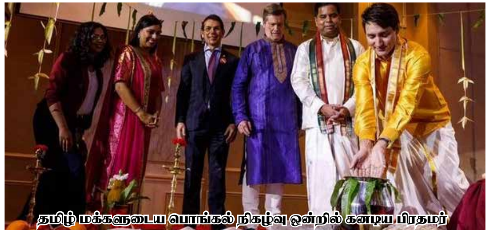
தமிழ் மக்களுடைய பொங்கல் நிகழ்வு ஒன்றில் கனடிய பிரதமர்