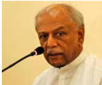
கவே இரண்டு மாதங்களுக்கு 5 ஆயிரம் ரூபாய் கொடுப்பனவை வழங்க அமைச்சரவை அனுமதியளித்துள்ளது” - என்றார். (இ)

இது தொடர்பில் அவர் கூறுகையில், “ஒன்றரை ஆண்டுகளாக அரசு அவர்களுக்கான சம்பளத்தை உரியவாறு வழங்கி வருகின்றது. இந்தநிலையில், தற்போது அதிபர்கள், ஆசிரியர்களுக்கு இணையவழி கற்பித்தல் நடவடிக்கைகளுக்காக ஏற்பட்டுள்ள மேலதிக செலவுகளுக்கா