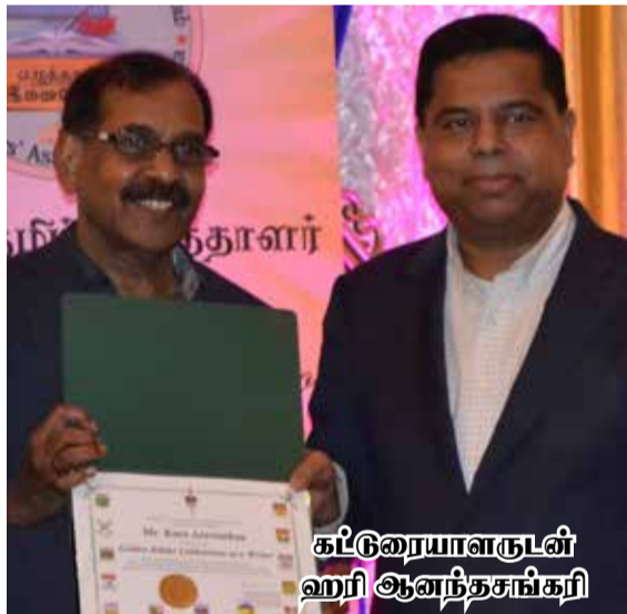
கட்டுரையாளருள் ஹரி ஆனந்தசங்கரி

கனடா பிரதமர் ஜஸ்டின் ட்ரூடோ, போல்டன் என்ற இடத்திற்கு லிபரல் கட்சியின் சார்பாகப் பிரசாரத்திற்காக ஓகஸ்ட் மாதம் 27 ஆம் திகதி சென்ற போது, ஒருசிலர் அமைதிக்குப் பங்கம் ஏற்படுத்த முனைந்ததால், பாதுகாப்புக் காரணங்களுக்காக அந்தக் கூட்டம் ரத்துச் செய்யப்பட்டுள்ளது. பொதுமக்களின் நலன்கள்பற்றிக் கவலைப்படாமல், சுயநலமாக இயங்கும் ஒரு கூட்டம் இங்கேயும் இருக்கத்தான் செய்கின்றது. 2019 ஆண்டு தேர்தலில் லிபரல் கட்சி 338 ஆசனங்களில் 157 ஆசனங்களையும், கன்சுவேட்டிக் கட்சி 121 ஆசனங்களையும் கைப்பற்றியிருந்தன. கனடாவில் தனியாக ஆட்சி அமைப்பதற்கு 170 ஆசனங்கள் தேவைப்படுகின்றன. கன்சுவேட்டிக் கட்சி அதிக வாக்குகளைப் பெற்றிருந்தாலும், அதிக ஆசனங்களைப் பெறவில்லை. இம்முறை கனடிய பொதுத்தேர்தலில் எந்த ஒரு கட்சியும் தனியாக அரசை அமைக்கப் பேவதில்லை என்று The Writ Polls என்ற தனியார் நிறுவனத்தில் பணியாற்றும் தேர்தல் கருத்துக் கணிப்பு நிபுணரான Erick Grenier குறிப்பிட்டிருப்பதும் கவனிக்கத்தக்கது. கோவிட் - 19 இன் பேரிடர் பாதிப்பு, அரசாங்கக் கட்டுப்பாடு, பொருளாதார நெருக்கடி, வேலையின்மை, பாடசாலைகள் இயங்காமை, தனிமைப்படுத்தல் போன்ற பல காரணங்கள் மக்கள் மனதைப் பெருமளவில் மாற்றியிருப்பதால், புதிதாக வரும் அரசாங்கம் பல பிரச்சனைகளை எதிர்நோக்க வேண்டியவரலாம். கோவிட்-19 பேரிடர் கனடாவுக்கு மட்டுமல்ல, இது எல்லா நாடுகளுக்கும் உள்ள பொதுவான பிரச்சனையாக இருந்தாலும், இதுவே கனடாவில் இந்தத் தேர்தலின் வெற்றி தோல்விகளை இம்முறை நிர்ணயிக்கப் போகின்றது.