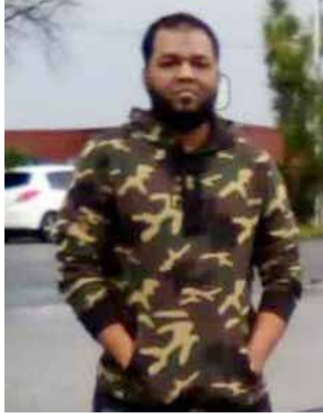
நியூசிலாந்து பொலிஸாரால் நேற்றுமுன்தினம் சுட்டுக்கொல்லப்பட்டார் என்பது குறிப்பிடத்தக்கது. (இ)

கத்திக்குத்து தாக்குதலை மேற்கொண்ட குறித்த நபர்