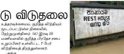
அதிக விவகை விற்பனை செய்வதற்காகவே, மதுபானங்களை கொண்டு செல்ல நடவடிக்கை எடுக்கப்படுவதாக, பொலிஸாருக்கு கிடைத்த தகவலுக்கமையே குறித்த விடுதி சுற்றிவணைக்கப்பட்டு, சந்தேகநபர்கள் கைதுசெய்யப்பட்டனர். தோட்டப்பறங்களில்

பொகவத்தலாவை நகரில் அமைந்துள்ள விடுதியிலிருந்து, மதுபான போத்தல்களை, மிகவும் குட்கமமாக டிராட்டப்பற மக்களுக்கு விநியோகிப்பதாக எடுத்துச் செல்ல முற்பட்ட குறித்த விடுதியின் உரிமையாளரை, நேர்வடிப் பிரதேச சபை உறுப்பினர் உள்ளிட்ட 7 பேர் சைந்துசெய்யப்பட்டு, கடுமையான எச்சரிக்கையில் பின்னர் விடுதலை செய்யப்பட்டார்கள்.