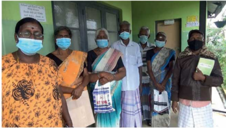
பெறும் வசதிகளைக் கொண்ட இத்த வைத்தியசாலை, சுடந்த 3 வகுடங்களாக முட்பட்ட்டுக்கும் அந்தேவனை, நடவடிக்கை எடுக்க கோரியுள்ளனர்.

மத்திய மாகாண சுகாதார சேவை பணிப்பாளர் அலுவலகத்தின் கீழ் நிறுவகிக்கப்பட்ட, வெஸ்ட்டோல் பிரதேச வைத்தியசாலையானது, சுடந்த 3 வகுடங்களாக முட்பட்ட்டுள்ளதால் குறித்த வைத்தியசாலையை அண்டித்த 5 டிராட்டமக்களைச் சேர்ந்த மக்கள் பாரிய அசௌகரியங்களை எதிர்நோக்கியுள்ளனர்.