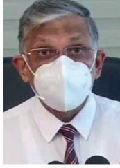
சந்தேக ஊடாக வழங்கப்பட்ட சீனி, விவாபாரிகள், தரக்கள் பதுக்கி வைத்திருந்த நிலையில் அரசாங்கத்தால் கைப்பற்றப்பட்டவையே என ஐக்கிய மக்கள் சக்தியின் பொதுச்செயலாளர் திணை அத்தராயக ஓடுகின்றார்.

எனினும் புதிய அரசாங்கம் ஆட்சிக்கு வந்ததன் பின்னர் அதனை 25 தடவை மாற்றியது. இதுதொடர்பாக பாரிய வரி ஏற்பாடு செய்யப்பட்டுள்ளது எனும் அவர் தெரிவித்தார். சந்தேக ஊடாக வழங்கப்பட்ட சீனி, விவாபாரிகள், தரக்கள் பதுக்கி வைத்திருந்த நிலையில் அரசாங்கத்தால் கைப்பற்றப்பட்டவையே என ஐக்கிய மக்கள் சக்தியின் பொதுச்செயலாளர் திணை அத்தராயக ஓடுகின்றார்.