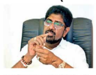
முன்னேற்றம் ஏற்பட்டுள்ளது என கூறாதார அமைச்சர் செ.கே.வேலு ரமபுக்கவெ தெரிவித்துள்ளார்.

கொரோனா வைரஸ் தொற்று ஏற்பட்டதன் பின்னர், மருத்துவ ஓட்சிசனில் தங்கியிருந்து சிகிச்சைப்பெற வேண்டிய நோயாளர்களின் எண்ணிக்கையில் ஏராள வர்த்தகி ஏற்பட்டுள்ளதாகக் கூறாதார அமைச்சு அறிவித்துள்ளது. "தனிமைப்படுத்தல் ஊட்டங்கு அமல்படுத்தப்பட்டுள்ள காலப்பகுதியில், கூறாதார ஆலோசனைகளை பொதுமக்கள் உரியவாறு பின்புறவதால், இந்த