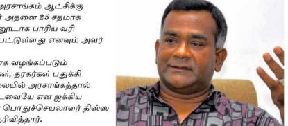
சந்தேக ஊடாக வழங்கப்பட்ட சீனி, விவாபாரிகள், தரக்கள் பதுக்கி வைத்திருந்த நிலையில் அரசாங்கத்தால் கைப்பற்றப்பட்டவையே என ஐக்கிய மக்கள் சக்தியின் பொதுச்செயலாளர் திணை அத்தராயக ஓடுகின்றார்.

எனினும் புதிய அரசாங்கம் ஆட்சிக்கு வந்ததன் பின்னர் அதனை 25 தடவை மாற்றியது. இதுதொடர்பாக பாரிய வரி ஏற்பாடு செய்யப்பட்டுள்ளது எனும் அவர் தெரிவித்தார். சந்தேக ஊடாக வழங்கப்பட்ட சீனி, விவாபாரிகள், தரக்கள் பதுக்கி வைத்திருந்த நிலையில் அரசாங்கத்தால் கைப்பற்றப்பட்டவையே என ஐக்கிய மக்கள் சக்தியின் பொதுச்செயலாளர் திணை அத்தராயக ஓடுகின்றார்.