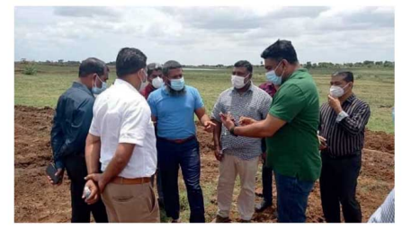
கருத்துத் தெரிவிக்கையில் 'தற்போது மையவாடிக்கான உட்கட்டமைப்பு வசதிகள் துரிதத்தில் மேற்கொள்ளப்பட்டு வருகின்றன. மையவாடிக்குள் 14 உள் வீதிகள் அமைக்கும் மையவாடியைத் துவக்கும் 10 கிலோமீட்டர் மதில் மீட்டப்பட்டுள்ளது. மின்சார வசதிகள் மற்றும் ஜனாஸாக்களின்

கொரோனா வைரஸ் தொற்றால் மரணிப்பவர்களின் ஜனாஸாக்களை அடக்கம் செய்வதற்கு கிணியாவில் வட்டமடு கிராமத்தில் 10 ஏக்கர் அரசு காணி ஒதுக்கப்பட்டுள்ளது. இக்காணியை, கொவிட் 19 தொழில்நுட்ப குழு ஆய்வுகளை மேற்கொண்டு சிபாரிசு செய்ததையடுத்து, கொவிட் 19 செயலணியாலும் சுகாதார அமைச்சாலும் அனுமதி வழங்கப்பட்டுள்ளது.