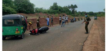
குடும்பம்தரே, இவ்வாறு படுகாயமடைந்துள்ளார்.

எம்.எஸ்.ஸ்ரீநிதி முல்லைத்தீவு, புதுக்குடியிருப்பு, ஓட்டுக்கட்டான் விதியில், மன்னாக்கட்டம் பகுதியில், நேற்று முன்தினம் (04) மாலை இடம்பெற்ற விடுதலைப் புலிகளின் குடும்பம்தர ஒருவர் படுகாயமடைந்த நிலையில், புதுக்குடியிருப்பு ஆதார வைத்தியசாலையில் அனுமதிக்கப்பட்டார். மன்னாக்கட்டம் பகுதியைச் சேர்ந்த 50 வயதுடைய