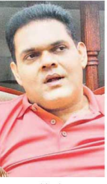
தவறான அறிவுறுத்தல்களை கற்றுக்கொடுக்கிறார். இது தொடர்பில் தள்ளுவரம்பலுடையவர்களும் அவர் தெரிவித்தார்.

வெளிப்பட்டுள்ளதோடு, இந்த வந்தமையின் அறிவித்தலில் உள்ள விவரங்கள் விட அதிகமாக விவரங்கள் பொருள்களின் விவரங்கள் சம்பவங்களுக்கு எதிராக நடவடிக்கைகள் மேற்கொள்ளப்பட்டு இதுவே, விவர அதிகரிப்பிற்கு காரணமாக இருக்கலாம். இது தொடர்பில் தள்ளுவரம்பலுடையவர்களும் அவர் தெரிவித்தார்.