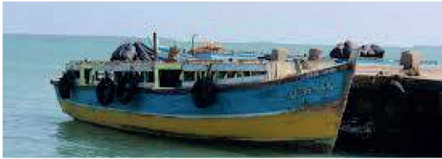
பொறுமைமீன் எல்லையில் வடக்கு கடற்றொழிலாளர்கள்