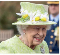
உடல் 10 நாட்கள் சுழித்து தகனம் செய்யப்படும்; இறுதிச்சடங்கு ஊர்வலம், இளவரசர் சார்ன்ஸ் தலைமையில் நடக்கும்; தகனம் செய்யப்படுவதற்கு முன், அரியணையில் ஏறவுள்ள இளவரசர் சார்ன்ஸ், பிரித்தானியாவில்

பி ரித்தானியாவின் ராணி 2 ஆம் எலிசபெத்திற்கு தற்போது 95 வயது ஆகிறது. இந்நிலையில் அவர் இந்த மின்னர் செயல்படவேண்டிய ஏற்பாடுகள் தொடர்பான ஆவணமொன்று வெளியே கசிந்து பரபரப்பை ஏற்படுத்தியுள்ளது. 'ஓப்ரேஷன் லண்டன் பிரிட்ஜ்' (Operation London Bridge) எனப் பெயரிடப்பட்டுள்ள இவ் ஆவணமானது, அமெரிக்காவைத் தலைமையகமாகக் கொண்ட 'பொலிசிகோ' (Politico) என்னும் செய்தி நிறுவனத்தினால் கசிவிடப்பட்டுள்ளது. குறித்த ஆவணத்தின்படி, ராணி எலிசபெத் இந்த மின்னர் அவரது