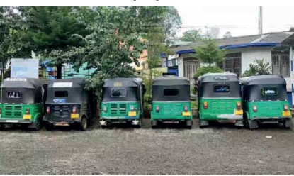
ஓட்டோக்கள், மோட்டார் சைக்கிள்கள் சேத்துதியவர்களுக்கு எதிராக, நுவரெலியா மாவட்ட

தனிமைப்படுத்தல் ஊரடங்கு சட்டத்தை மீறி தலவாக்கலை நகருக்குள் பயனித்த, 17 ஓட்டோக்களையும் மோட்டார் சைக்கிள்களையும் தலவாக்கலை பொலிஸார் கைப்பற்றினர்.