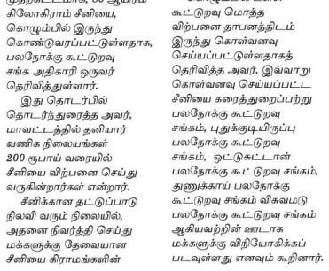
கூட்டுறவுச் சங்கங்கள் ஊடாக வழங்கும் நடவடிக்கையில் பலநோக்குக் கூட்டுறவுச் சங்கம் ஈடுபட்டுள்ளது எனவும், அவர் தெரிவித்தார்.

எம்.எஸ்.ஸ்ரீநிதி முல்லைத்தீவு மாவட்டத்தின் சீனி பற்றாக்குறையை நிவர்த்தி செய்வதற்காக அரசாங்கத்தால் அறிவிக்கப்பட்ட இவ்வ நிர்வகியத்தில், மக்களுக்கு சீனியை வழங்கும் நடவடிக்கைகள், பலநோக்கு கூட்டுறவுச் சங்கம் ஈடுபட்டுள்ளது. முல்லைத்தீவு மாவட்டத்துக்கு, முதற்கட்டமாக, 80 ஆயிரம் கிலோகிராம் சீனியை, கொழும்பில் இருந்து இறக்குவரப்பட்டுள்ளதாக, பலநோக்கு கூட்டுறவுச் சங்க அதிகாரி ஒருவர் தெரிவித்துள்ளார். இது தொடர்பில் தொடர்ந்துரைத்து அவர், 'மாவட்டத்தின் தனியார் வணிக நிலையங்கள் 2000 பம்ப வரையில் சீனியை விற்பனை செய்து வருகின்றார்கள் என்றார். சீனிகளின் தட்டுப்பாடு நிலவிய சந்தர்ப்பத்தில், அதனை நிவர்த்தி செய்து இறக்குவரத்து தேவையான சீனியை கிராமங்களின்