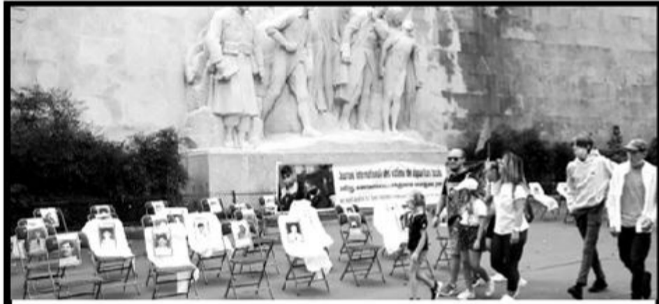
வலிந்து காணாமலாக்கப்பட்ட தமிழர் உறவுகளுக்கு நிதிவேண்டி ஐ.நா மனித உரிமைச்சாசன முன்வரைவு எழுதப்பட்ட பரிஸ்-மனித உரிமைச் சதுக்கத்தில் கவனயீர்ப்பு நிகழ்வு இடம்பெற்றது. நாடுகடந்த தமிழீழ அரசாங்கம், தமிழீழ மக்கள் பேரவை ஆகியன இணைந்து ஏற்பாடு செய்திருந்த இந்நிகழ்வானது, ஒகஸ்ட்-30 வலிந்து காணாமலாக்கப்பட்டவர்களுக்கான அனைத்துலக நாளில் இடம்பெற்றிருந்தது.

அத்தகைய திட்டங்கள் இல்லாமல், மக்களையோ சுகாதாரத்துறையையோ குற்றம் சொல்ல வேண்டாம் என்றும் மருத்துவர் தெரிவித்தார். (நி-5)