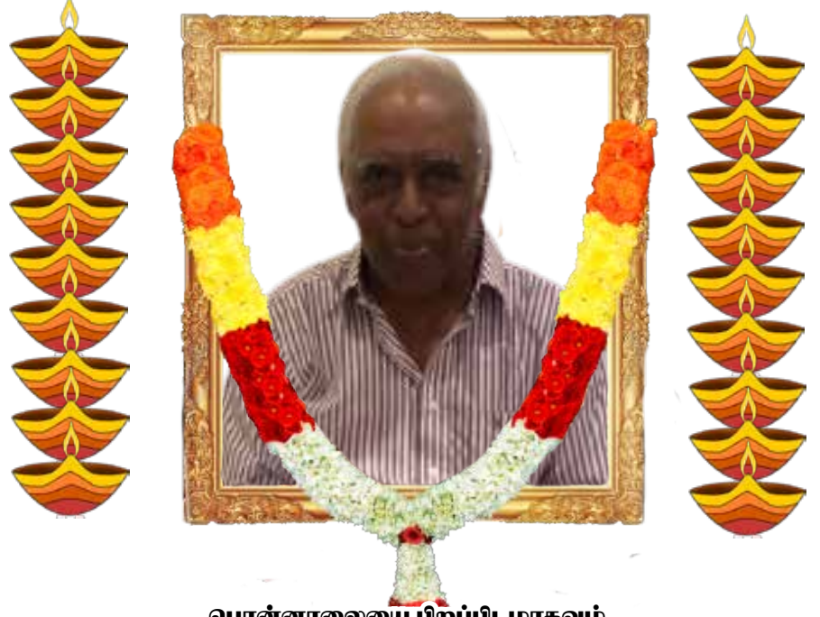
பொன்னாலையை பிறப்பிடமாகவும், மாவிட்டபுரம் கொல்லங்கலட்டியை வதிவிடமாகவும் கொண்ட