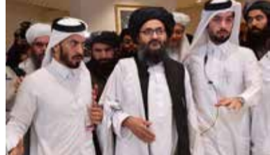
காபூல், செப். 08

ஆப்கானிஸ்தானில் ஆட்சி அமைப்பதில் தலிபான் பிரிவுகளிடையே ஏற்பட்ட மோதலில் அதன் அரசியல் குழு தலைவர் முல்லா அப்துல் கனி பரதர்