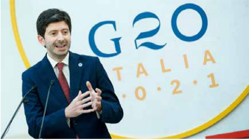
ரோம், செப். 08

கோவிட் 19 தொற்று நோயை கட்டுப்படுத்த உதவும் வகையில் ஏழை நாடுகளுக்கு நிதி மற்றும் தடுப்பூசிகளை நன்கொடையாக வழங்க ஜி - 20 நாடுகளின் சுகாதார அமைச்சர்களின் கூட்டத்தில் தீர்மானிக்கப்பட்டுள்ளது.