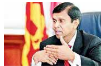
நியமிக்கப்படவுள்ளதாகவும் தகவல்கள் வெளியாகியுள்ளன.

அதன் மூலம் 60 வயதுக்கு மேற்பட்டோரின் இறப்புகளை குறைத்துக் கொள்ள முடியும். இவை யாவும் நிறைவு செய்து அடுத்த இரண்டு வாரங்களுக்குள் தடுப்பூசி வழங்கும் செயல்பாடு நிறைவடைந்த பின்னர் 20வயதுக்கும் 30 க்கும் இடைப்பட்டோருக்கான தடுப்பூசி வழங்கும் வேலைத் திட்டத்தை ஆரம்பிக்கவுள்ளோம். இந்த பெருந் தொற்று காலப் பகுதியிலே இறப்புகளைத் தடுப்பதே எமது நோக்கமாக காணப்படுகின்றது. இறப்புகளைத் தவிர்க்க வேண்டுமாக இருந்தால் நாங்கள் கட்டாயமாக தடுப்பூசியை பெற்றுக் கொள்ளவேண்டும்-என்றார்.