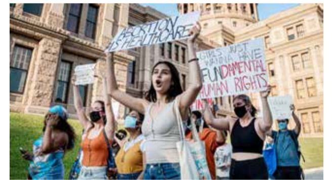
வாஷிங்டன், செப். 08

அமெரிக்காவில் கருக்கலைப்புக்கு விதிக்கப்பட்ட தடையை எதிர்த்து பெண்கள் நடத்தும் நூதன போராட்டம் பெரும் பரபரப்பை ஏற்படுத்தியுள்ளது. கருக்கலைப்பு செய்வது குற்றம் என்பதால், அமெரிக்காவின் ரெக்லாஸ் மாகாணம் அதற்கு தடை விதித்துள்ளது. வயிற்றில் சிசுவின் இதயத் துடிப்பு கேட்க முன்பாக கருக்கலைப்பு செய்யலாம் என்று அந்த மாகாண அரசு அறிவித்துள்ளது.