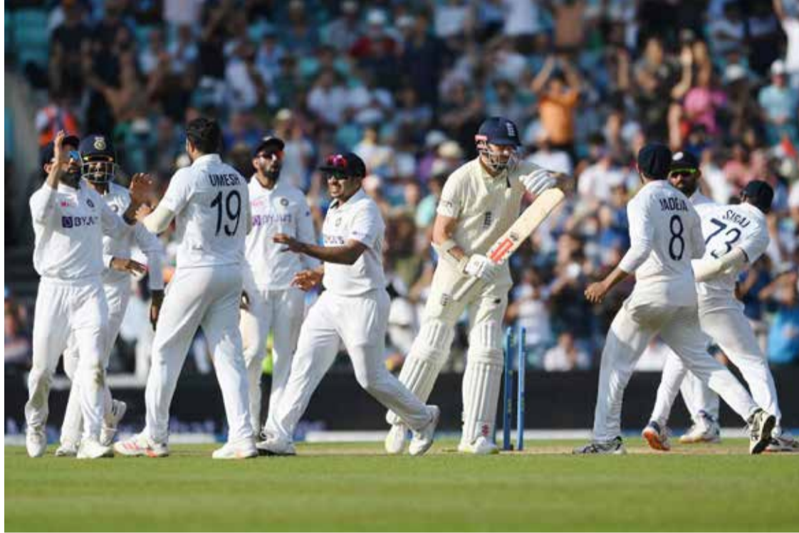
இருக்கும் என தகவல் தெரிவிக்கப்பட்ட நிலையில் இந்திய பந்துவீச்சாளர்கள் அடுத்தடுத்து விக்ரெட்டை வீழ்த்தி இங்கிலாந்து அணிக்கு நெருக்கடி

ஓவல் ஆடுகளம் கடைசி நாள் முழுவதும் துடுப்பாட்ட வீரர்களுக்குத்தான் சாதகமாக