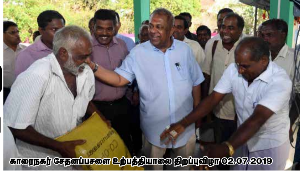
காரைநகர் சேதனப்பசளை உற்பத்தியாலை திறப்புவிழா 02.07.2019

கூடாக நியாயமான விலையில் அத்தியாவசிய பொருட்களை விநியோகிக்க வேண்டும். அதாவது துறைநீதியாக கூட்டுறவுகள் ஒன்றுடன் ஒன்று இணைந்து வலையமைப்பாக இயங்க வேண்டும். குறித்த பிரதேசத்தில் அதிகளவு உற்பத்தியாகும் பொருட்களை தேவையேற்படும் இடங்களுக்கு விநியோகம் அல்லது சந்தைப்படுத்தலை செய்யலாம். இதற்கு கூட்டுறவுகளிடம் உள்ள கட்டிடங்கள், வாகனங்கள், ஆளணி மற்றும் நிதி ஆகிய வளங்கள் இனங்காணப்பட்டு அவை உச்சமாக பயன்படுத்தப்படும்போது நியாயமான விலையில் பொருட்களை மக்கள் பெற்றுக் கொள்ளக்கூடியதாக இருக்கும். மங்கள் சமரவீரவின் முதலீடுகள் உட்பட கூட்டுறவுத்துறையிடம் தற்