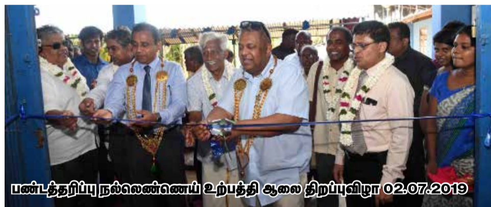
பண்பத்தரிப்பு நல்லெண்ணெய் உற்பத்தி ஆலை திறப்புவிழா 02.07.2019

வாக்க பயன்படுத்த வேண்டும். குறிப்பாக பாவுப்பத்தியை அதிகரிக்கும் கால் நடை வளர்ப்புக்கான கடன்கள், விவசாய உற்பத்திகளை ஊக்குவிப்பதற்கான விவசாயக் கடன்கள், பணமாக அல்லது பொருளாக கடற்றொழிலாளர்களின் வாழ்வாதாரத்தை மேம்படுத்தக்கூடிய கடன்திட்டங்கள் என தற்போதுள்ள திட்டங்கள் விரிவுபடுத்தப்படுவதோடு புதிய திட்டங்கள் அறிமுகப்படுத்தப்பட வேண்டும். கூட்டுறவுத்துறைக்குள்ளும் நிதி தேவைப்படும் பகுதிகளுக்கு நிதியை வைத்திருக்கும் கூட்டுறவுகள் வழங்க முன்வரவேண்டும். எடுத்துக்காட்டாக நிதிக்கூட்டுறவுகள் உற்பத்திக்கூட்டுறவுகளின் உற்பத்தி செயல்பாடுகளுக்கோ நுகர்ச்சிக் கூட்டுறவுகளின் மொத்தக் கொள்வனவுகளுக்கோ நிதியை வழங்கலாம். நுகர்ச்சிக் கூட்டுறவுச் சங்கங்களுக்கு