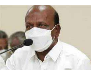
தாரத்துறை மந்திரி மன்சூக் மாண்டலியாவுக்கு, அமைச்சர் மா.சுப்பிரமணியன் கடிதம் எழுதியுள்ளார்.

தொகை 15 சதவீதம் பேருக்கும் தடுப்பூசி போடப்பட்டுள்ளது. இந்த சூழலில் தமிழகத்தில் வரும் செப்டம்பர் 12 ஆம் தேதி ஒரே நாளில் 10,000 தடுப்பூசி முகாம்கள் மூலம் 20 இலட்சம் தடுப்பூசிகள் போட தமிழக அரசு திட்டமிட்டுள்ளது. இதற்கு 1 கோடி கொரோனா தடுப்பூசிகள் தேவையாக உள்ளது. இந்நிலையில், சிறப்பு முகாம் நடத்த இருப்பதால் கூடுதலாக ஒரு கோடி கொரோனா தடுப்பூசி தேவை என்று கூறி, மத்திய சுகா