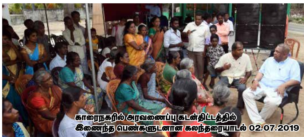
காரைநகரில் அரவணைப்பு கடன்திட்டத்தில் இணைந்த பெண்களுடனான கலந்தரையாடல் 02.07.2019

எளிமையான, இனிமையான, நேர்மையான, பண்பான, நீதியான ஒரு தலைவனை எம் கூட்டுறவு நண்பனை இழந்துவிட்டோம். இத் துயரில் எமது மாகாணம் சார்ந்த ஆயிரமாயிரம் கூட்டுறவாளர்களின் இதய அஞ்சலியை செலுத்தி அமரரின் ஆத்ம சாந்திக்கு