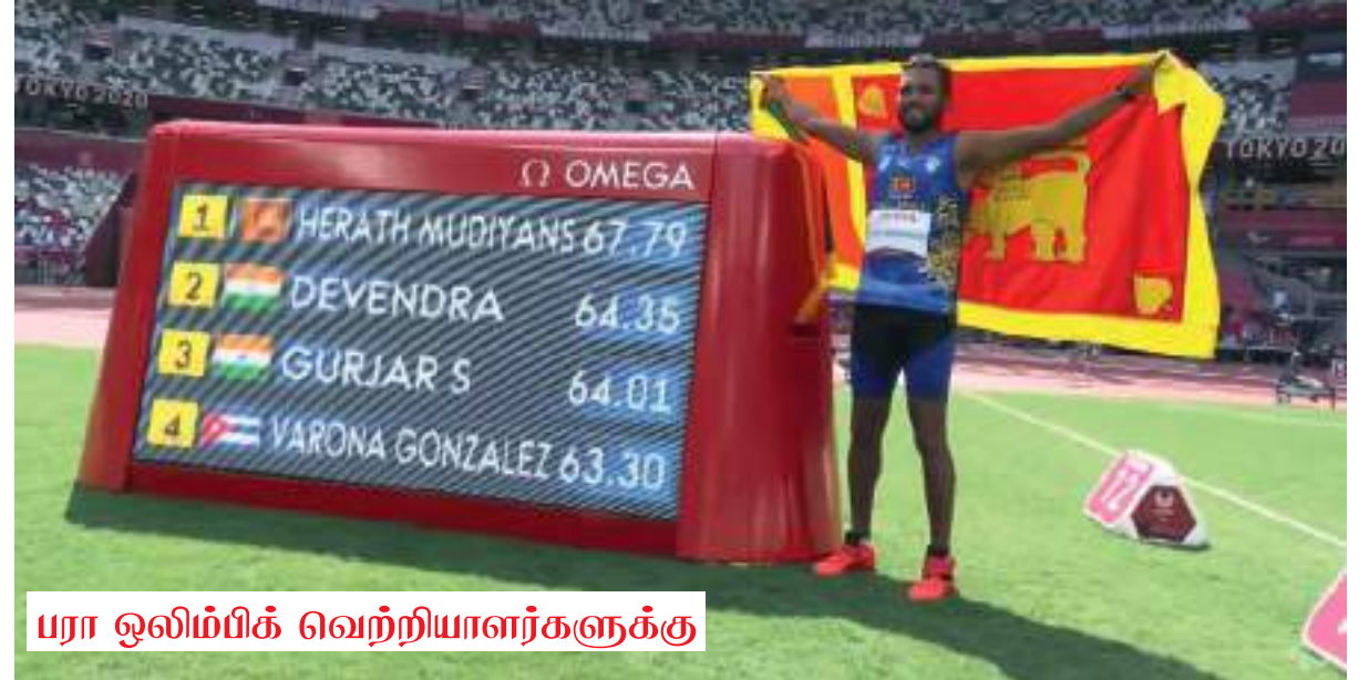
பரா ஒலிம்பிக் வெற்றியாளர்களுக்கு

சதவீதம் பேர் அமைச்சர் டாரோ கோனோவுக்கும் 27 சதவீதம் பேர் பாதுகாப்புத் துறை முன்னாள் அமைச்சர் ஷிகெரு இஷிபாவுக்கும் ஆதரவு தெரிவித்துள்ளனர். வெளியுறவு முன்னாள் அமைச்சர் ஃபுமியோ கிஷிடாவுக்கு 19 சதவீத ஆதரவு கிடைத்துள்ளது.