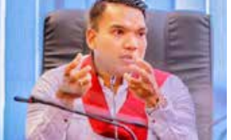
(இ.கலையமுதன்) இளைஞர் மற்றும் விளை யாட்டுத்துறை அமைச்சர்