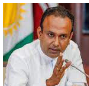
அதிபர்கள், ஆசிரியர்களுக்கான 5 ஆயிரம் ரூபா இடைக்காலக் கொடுப்பனவு இந்த

மாதச் சம்பளத்துடன் கிடைக்கப்பெறும் என்று அமைச்சரவை இணைப் பேச்சாளர் அமைச்சர் ரமேஷ் பத்திரண தெரிவித்துள்ளார்.