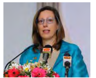
அத்தோடு பொருளாதார ரீதியில் வெற்றியளிச்சுக்கூடிய கொள்கைகளை வகுப்பது குறித்து இலங்கை அரசாங்கம் முனைப்பு காட்ட வேண்டும் என்றும் அவர் வலியுறுத்தினார். (அ)

மக்களுக்கும் பொறுப்பு கூற வேண்டும் என்பதே அமெரிக்காவின் நிலைப்பாடு என்பதனால் கடந்த கால மற்றும் நிகழ்காலத்தில் உள்ள மனித உரிமை பிரச்சனைகளுக்கு தீர்வு காணப்பட்டு அதற்கு நியாயம் வழங்கப்படவேண்டும் எனவும் அவர் குறிப்பிட்டார். மேலும், நல்லிணக்க முயற்சிகள், நிலைபேறுகால நீதிப் பொறிமுறையையும் சமாதானத்தையும் நிலை நாட்டுவதில் அமெரிக்கா தொடர்ந்தும் இலங்கைக்கு ஒத்துழைப்பு வழங்கும் என்றும் அலைனா ரெப்லிட்ஸ் குறிப்பிட்டார்.