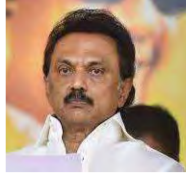
நிறைவேற்றியது போன்ற பல வற்றை சொல்லலாம்.

“தி.மு.க. எப்போதெல்லாம் ஆட்சிப் பொறுப்பை ஏற்றதோ, அப்போதெல்லாம் அது தமிழின் ஆட்சியாக, தமிழினத்தின் ஆட்சியாகத்தான் இருந்துள்ளது. தமிழ் மாநிலத்துக்குத் “தமிழ் நாடு” என்று பெயர் சூட்டியது நூற்றாண்டுக் கனவான செம்மொழித் தகுதியைத் தமிழுக்குப் பெற்றுத் தந்தது “மெட்ராஸ்” என்ற பெயரைச் “சென்னை” என மாற்றியது, தமிழ், ஆங்கிலம் என்ற இருமொழிக் கொள்கையை