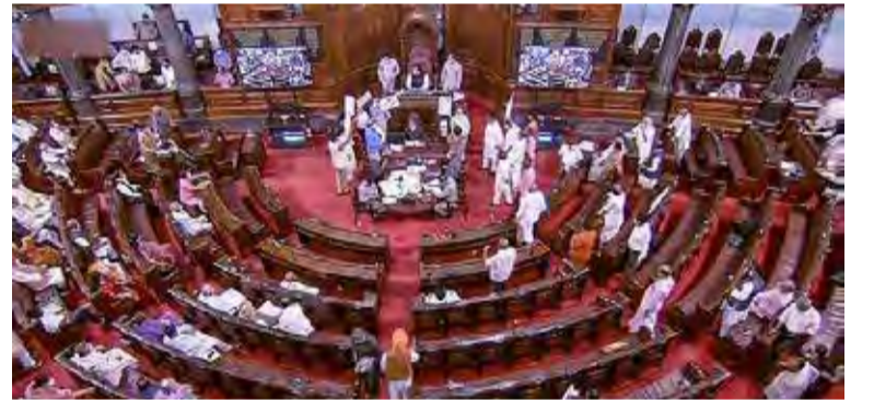
காலியாக உள்ள நிலையில், அதனை நிரப்பத் தேர்தல் ஆணையம் தேர்தல் திகதியை அறிவித்துள்ளது.

அந்த அறிவிப்பில், “தமிழகத்தில் காலியாகவுள்ள 2 மாநிலங்களவை இடங்களுக்கு வரும் ஓக்ரோபர் மாதம் 4ஆம் தேதி தேர்தல் நடைபெறும். அன்று காலை 9 மணி முதல் 4 மணி வரை தேர்தல் நடைபெறும்.