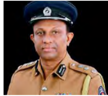
கள் அதிகமாக உள்ளன.

சமூக இடைவெளி மற்றும் முறையான சுகாதார வழிமுறைகளைப் பின்பற்றாத மக்களுக்கு கிடையே கொரோனாத் தொற்று நோய் பரவுவதற்கான வாய்ப்புகள் அதிகமாக உள்ளன.