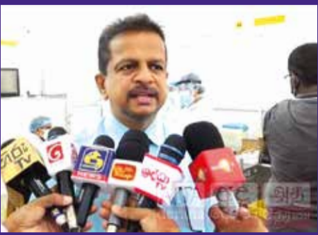
தடுப்பூசி வழங்குவதற்கான காலம் வரும்போது வழங்கவேண்டிய தடுப்பூசிகளின் எண்ணிக்கை மற்றும் ஏனைய தடுப்பூசிகளுடன் மூன்றாம் கட்டமாக செலுத்தக்கூடிய தடுப்பூசியை