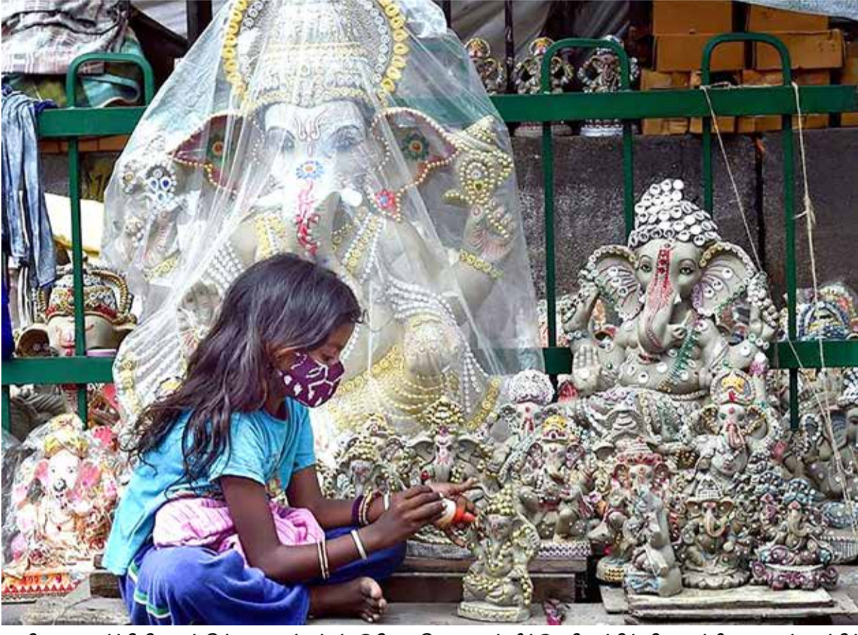
விநாயக சதுர்த்தி திருநாள் இன்று அனுஷ்டிக்கப்படுகிறது. இதனைமுன்னிட்டு தமிழகத்தில் விநாயகர் சிலை அலங்காரத்தில் ஈடுபட்டுள்ள சிறுமியொருவரை படத்தில் காணலாம்.