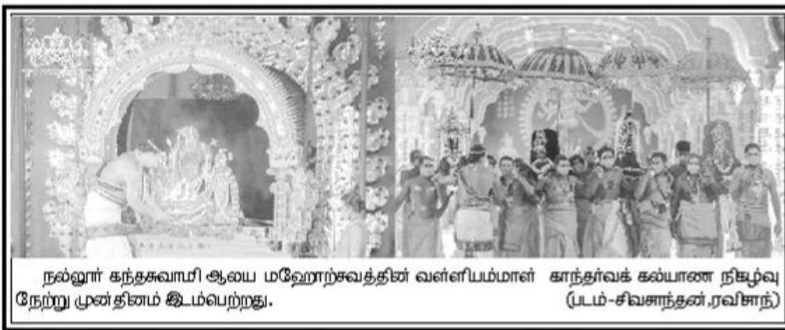
நல்லூர் கந்தசுவாமி ஆலய மஹோற்சவத்தின் வள்ளியம்மாள் கார்த்தர்வக் கல்யாண நிகழ்வு நேற்று முன்தினம் இடம்பெற்றது.

கிழக்கில் அமைத்து கொரோனா வைரஸ் தொற்றால் உயிரிழப்போரின் இறுதிக்கிரியைகளை மேற்கொள்ள நடவடிக்கை எடுக்க வேண்டும் என அவர் தெரிவித்தார். (நி-5)