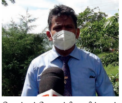
செலுத்தும் வேலைத்திட்டத்தில் முதல் இரண்டு டோஸ்களும் சகலருக்கும் செலுத்தப்பட்டுள்ளன.