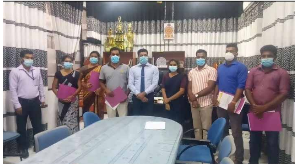
கட்டுப்பாட்டு விலைகளில் பொருள்கள் விற்கப்படுவதை அவதானிக்க

தடுப்பூசி வழங்கல் இதுவரை கிழக்கு மாகாணத்தில் கிட்டத்தட்ட முதலாவது டோஸ் 90 வீதமானோரும், இரண்டாவது டோஸ் 75 வீதமானோருக்கு தடுப்பூசி வழங்கப்பட்டுள்ளது. மேலும் 20 வயதிற்கும் 30 வயதிற்கும் உட்பட்டவர்களுக்கு தடுப்பூசி விரைவில் வழங்க உத்தேசிக்கப்பட்டுள்ளது. பொதுமக்கள் சுகாதார நடைமுறைகளை பின்பற்றி நடக்க வேண்டும் என்றார்.