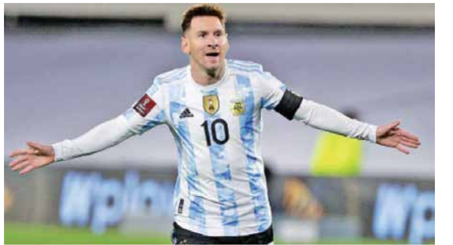
அதிக கோல்கள் அடித்த தென்னமெரிக்க வீரர்

சர்வதேச கிரிக்கெட் சபையின் விதிகளின்படி, டெஸ்ட் போட்டிகளில் விளையாடும் அனைத்து நாடுகளிலும் மகளிர் அணியும் இருக்க வேண்டும் என்பது கட்டாயமாகும் என்பதை டிம் பெய்ன் சுட்டிக்காட்டியுள்ளார்.