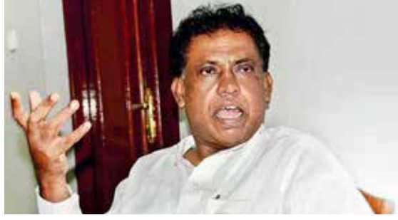
அவர் கோப்பாய் கொரோனா சிகிச்சை நிலையத்துக்கு அழைத்துச் செல்லப்பட்டுள்ளார்.