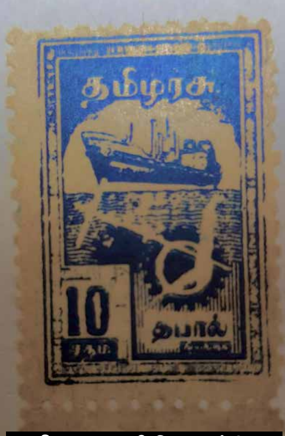
தமிழரசு வெளியிட்ட முத்திரை