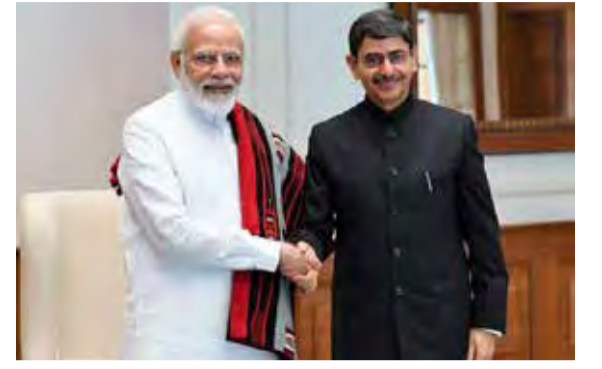
முறைகேடுகளைத் துப்பு துலக்கினார்.

பீகாரில் உள்ள பாட்னாவில் பிறந்த ரவீந்திர நாராயண் ரவி 1974 இல் இயற்பியலில் முதுகலைப் பட்டம் பெற்றார் மற்றும் பத்திரிகைத் துறையில் சிறிது காலம் பணியாற்றிய பிறகு 1976இல் ஐ.பி.எஸ். தேர்வில் வெற்றிபெற்று இந்திய காவல் பணியில் சேர்ந்தார். அவருக்கு கேரளா கேடர் ஒதுக்கப்பட்டது. பத்தாண்டுகளுக்கும் மேலாக கேரளாவில் மாவட்ட எஸ்.பி. உட்பட பல்வேறு பதவிகளில் கேரளாவில் பணியாற்றினார், பின்னர் சி.பி.ஐ-யில் பணியாற்றியபோது, சுரங்க மாபியாக்கள் உட்பட பல்வேறு