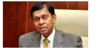
ரிக்கப்பட்டுள்ளது எனவும் தெரியவருகின்றது. அத்துடன், சில விசேட அதிகாரங்களும் மத்திய வங்கி ஆளுநருக்கு வழங்கப்படவுள்ளது. (அ)

மத்திய வங்கி ஆளுநராக பதவியேற்கவுள்ள அஜித் நிவாட் கப்ராலுக்காக விசேட அமைச்சரவைப் பத்திரமொன்று தயாரிக்கப்பட்டுள்ளது எனவும், கப்ராலால் முன்வைக்கப்பட்ட சில நிபந்தனைகளை நிறைவேற்றும் விதத்திலேயே குறித்த அமைச்சரவைப் பத்திரம் தயா