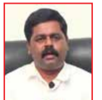
சிவஞானம் சிறீகந்தன், பாராளுமன்ற உறுப்பினர்.

மக்கள் மனங்களை ஆன்மீக வழியில் ஆற்றுப்படுத்தும் ஓர் அரும்பணி இலங்கையில், இந்து மதம் சார் முதல் தமிழ் ஆன்மீக அலைவரிசை என்ற பெருமைக்குரிய, டான் தொலைக்காட்சியின் “ஓம்” அலைவரிசை தனது பணி தொடங்கி பத்து ஆண்டுகளைப் பூர்த்தி செய்திருப்பது மனமகிழ்வளிக்கிறது. அதிலும் குறிப்பாக, இப்பெருந்தொற்றுக் காலத்தில் சுகாதார விதிமுறைகளுக்கமைய நடைபெற்று முடிந்த நல்லூரான் பெருந்திருவிழாவில் கலந்துகொள்ள முடியாமல் போன காலச்சூழலை நினைந்துருகி நின்ற அடியவர்களுக்கு ஒரேயொரு ஆறுதலாய் அமைந்தது. இவ்வாறாக, காலத்தின் தேவை கருதி, மக்கள் மனங்களை ஆன்மீக வழியில் ஆற்றுப்படுத்தும் ஓர் அரும்பணியை சீர்மையாய் செய்து வரும் ஓம் அலைவரிசையின் வளர்ச்சிக்காக, அதன் பத்தாவது ஆண்டு நிறைவில் எனது உடன்பூர்வமான வாழ்த்துக்களைப் பகிர்ந்து கொள்கிறேன்.