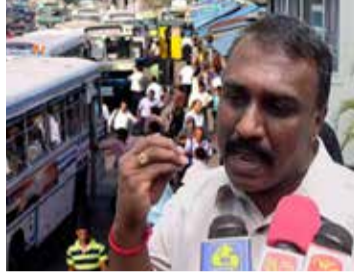
எனவே, அரசு இது குறித்து கவனம் செலுத்தி பஸ் ஊழியர்களுக்கு நிவாரணப் பொதியை வழங்குவதற்கு நடவடிக்கை எடுக்க வேண்டும் என்றும், இல்லையேல் ஊரடங்கு நீங்கிய பின்னர் பஸ்கள் இயங்காது என்றும் அவர் மேலும் கூறினார். (இ)