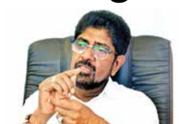
அமைச்சர் கூறியுள்ளார். அதற்கமைய, புத்திஜீவிகள் குழு, கல்வி அமைச்சு மற்றும்

இந்த விடயம் தொடர்பில் இதுவரை இரண்டு விடயங்கள் முன்வைக்கப்பட்டுள்ளதாக