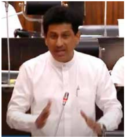
நிலைக்கு வந்துள்ளோம். மூன்றாவது தடையையாக வந்த இந்தக் கொரோனா அலை எம்மைப் பாரியளவில் பாதிப்புக்கு உள்ளாகியுள்ளது" - என்றார். (இ)

காலதாமதமாக எடுக்கப்பட்ட முடிவுகள் காரணமாகத்தான் நாம் இன்று இந்த