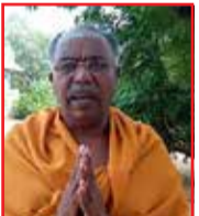
- கனாகி ஆறுதிருமுகன்

மக்கள் மனதை ஆற்றுப்படுத்தும் விதத்தில் அமைத்த ஒளிபரப்பு ஓம் தொலைக்காட்சி ஆற்றிவரும் உன்னத பணி பாராட்டுக்குரியது. வீட்டிலிருந்துவாறே திருக்கோவில்களை சிறப்பாகத் தரிசிக்கும் பேற்றினை தரும் டான் நிறுவனத்துக்கு நம் சமூகம் என்றும் நன்றிக்கடன் பட்டுள்ளது. குறிப்பாக நல்லூர் கந்தனின் திருவிழாவை மக்கள் நேரில் தரிசிக்க முடியாத சூழலில் இருந்த வேளை, மக்கள் மனதை ஆற்றுப்படுத்தும் விதத்தில் ஓம் தொலைக்காட்சி காலை மாலை மிக அழகாகத் திருவிழாவைத் தரிசிக்க வைத்தமை பெருமைக்குரிய விடயமாகும். ஓம் தொலைக்காட்சியின் உன்னதப்பணிக்கு சைவ மக்கள் சார்பில் நன்றியையும் பாராட்டுக்களையும் தெரிவித்து மகிழ்கிறேன்.