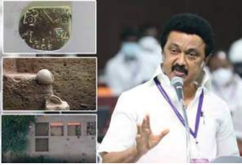
திருநெல்வேலி நகரில் 15 கோடி ரூபாய் செலவில் நவீன வசதிகளுடன் தொல்லியல் அருங்காட்சியகம் அமைக்கப்படும். கொற்கைத் துறைமுகம் கி.மு. ஆறாம் நூற்றாண்டுக்கு முந்தையது என ஆய்வாளர்கள் தெரிவித்துள்ளனர். பொருளை ஆற்றங்கரை நாகர்க்கம் 3,200 ஆண்டுகள் பழமையானது என வசதிகளுடன் தொல்லியல் அருங்காட்சியகம் அமைக்கப்படும்.

த மிழ் பண்பாட்டு அடையாளங்களை தேடி, இனி உலகமெங்கும் பயணம் செய்வோம். என தமிழக முதலமைச்சர் மு.க.ஸ்டாலின் தெரிவித்தார். மேலும், இந்தியத் துணைக் கண்டத்தின் வரலாறு இனி தமிழ் நிலப்பரப்பில் துவங்கித்தான் எழுதப்பட வேண்டுமெனவும் உறுதிப்படுத்த தெரிவித்தார். தமிழக சட்டசபையில் 110 வது விதியின் கீழ் முதலமைச்சர் மு.க.ஸ்டாலின் சில அறிவிப்புகளை வெளியிட்டார் அதன் விவரம் வருமாறு: -கீழடி, உலகமெங்கும் கவனத்தைப் பெற்றுள்ளது. கீழடி அகழாய்வை மத்திய அரசாங்கம் பாதுகாக்க வைக்கப்பட்டு கீழடி மூலம் சங்ககால தமிழர்களின் வாழ்க்கை முறையை உலகமே அறிந்துள்ளது. அங்கு நான்காம் நூற்றாண்டைச் சேர்ந்த வெள்ளிக்காசு கண்டறியப்பட்டுள்ளது.