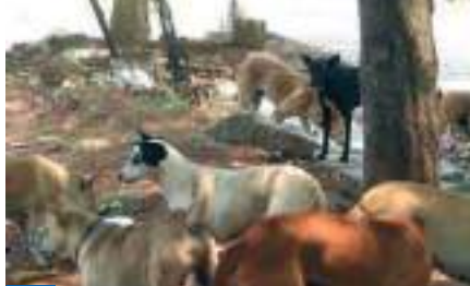
குழுவையுடனான துவலவையுடன் இக்ளவிக்ஞறி

இந்த நாடுகளின் பாதுகாப்பு, வெளியுறவு அமைச்சர்கள் 2+2 பேச்சுவார்த்தை என்ற பெயரில் ஒருவருக்கொருவர் பேச்சுவார்த்தை நடத்தி வருகிறார்கள். அந்தவகையில், அவுஸ்திரேலிய பாதுகாப்பு அமைச்சர் பீட்டர் டட்டான், வெளியுறவுத் துறை அமைச்சர் மரிஸ் பன்னே ஆகியோர் இந்தியா வருகிறார்கள். பீட்டர் டட்டான், இந்திய பாதுகாப்பு அமைச்சர் ராஜ்நாத்சிங்குடனும், மரிஸ் பன்னே, மத்திய வெளியுறவுத்துறை அமைச்சர் ஜெய்சங்கருடனும் பேச்சுவார்த்தை நடத்துகிறார்கள். பொருளாதார பாதுகாப்பு, இணைய பாதுகாப்பு, பருவநிலை உள்ளிட்ட பிரச்சினைகள் குறித்து இருதரப்பினரும் பேச்சு உள்ளனர். மேலும், கொரோனாவை கட்டுப்படுத்த கூட்டு நடவடிக்கைகள், சமமான, பாதுகாப்பான முறையில் தடுப்பூசிகள் விநியோகம், சர்வதேச பொருளாதார மீட்டிக்கான முயற்சிகள் ஆகியவை குறித்தும் அவர்கள் விவாதிக்க உள்ளனர். இந்திய பாதுகாப்பு அமைச்சர், இந்தோனேஷியா, தென்கொரியா, அமெரிக்கா ஆகிய நாடுகளுக்கும் அவர்கள் செல்வு உள்ளனர்.