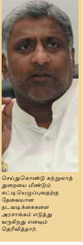
செய்துகொண்டு சுற்றுலாத் துறையை மீண்டும் கட்டியெழுப்புவதற்கு தேவையான நடவடிக்கைகளை அரசாங்கம் எடுத்து வருகிறது எனவும் தெரிவித்தார்.

தடுப்பூசிகளின் இலக்கு முழுமையடையும்போது, நாட்டில் காணப்படும் பயணக்கட்டுப்பாடுகள் நீக்கப்படுமென சுற்றுலாத் துறை அமைச்சர் பிரசன்ன ரணதுங்க தெரிவித்துள்ளார். சுற்றுலாப் பயணிகளிடமிருந்து இலங்கையர்களுக்கும், இலங்கையர்களிடமிருந்து சுற்றுலாப் பயணிகளுக்கும் கொரோனா வைரஸ் தொற்று பரவாதிருக்கும் வகையில் வேலைத்திட்டமொன்று நடைமுறைப்படுத்தப்படும் எனவும் அமைச்சர் பிரசன்ன ரணதுங்க தெரிவித்தார். கொரோனா வைரஸ் தொற்றுக்கு மத்தியில் நாட்டை முன்னோக்கிக் கொண்டு செல்லுவதற்கு முதலில் நாட்டு மக்களின் உயிர்கள் பாதுகாக்கப்பட வேண்டுமென ஜனாதிபதி கோட்டாபய ராஜபக்ஷ உறுதியாக நம்புவதாகவும் அவர் கூறினார். நாட்டு மக்களினதும், சுற்றுலாப் பயணிகளினதும் சுகாதாரப் பாதுகாப்புக்களை உறுதி