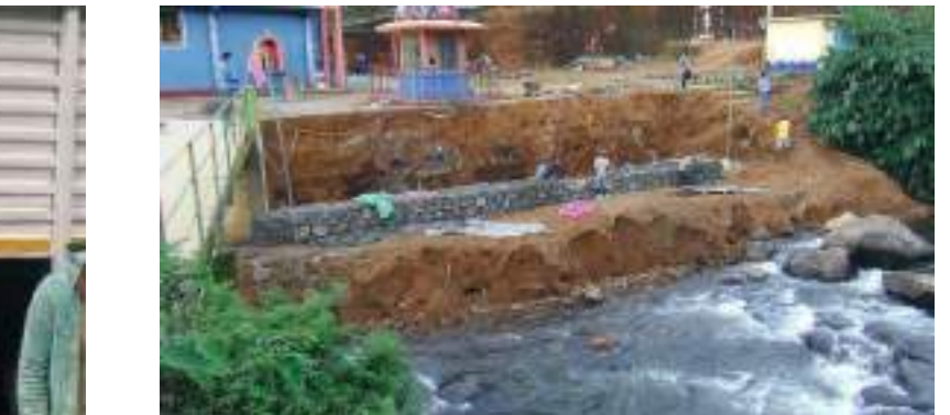
டயகம கோவிலையும் பாலத்தையும் பாதுகாக்க