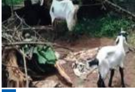
வளர்ப்பு ஆடுகளுக்கு நிபா பரிசோதனை;

உடனடியாக அரசாங்க படகில் இருந்தவர்கள், தண்ணீரில் தத்தளித்த பலரையும் மீட்டனர். தகவல் அறிந்த தேசிய பேரிடர் மீட்பு படையினர் தேடுதல் மற்றும் மீட்பு பணிகளை தொடங்கி உள்ளனர். இதுகுறித்து அதிகாரி ஒருவர் கூறியதாவது: கவிழ்ந்த படகில் இருந்த 41 பேர் மீட்கப்பட்டு உள்ளனர். மற்றவர்களை தேடும் பணி தொடங்கியது. பலியானோர் உடல் ஏதும இதுவரை கண்டுபிடிக்கப்படவில்லை. அத்துடன், படகில் பயணியேற்றாதேர் எண்ணிக்கையும் உறுதியாக தெரியவில்லை. எனவே, விபத்து குறித்த முழுமையான தகவல்களை தற்போது வெளியிட இயலவில்லை. இவ்வாறு அவர் கூறினார்.