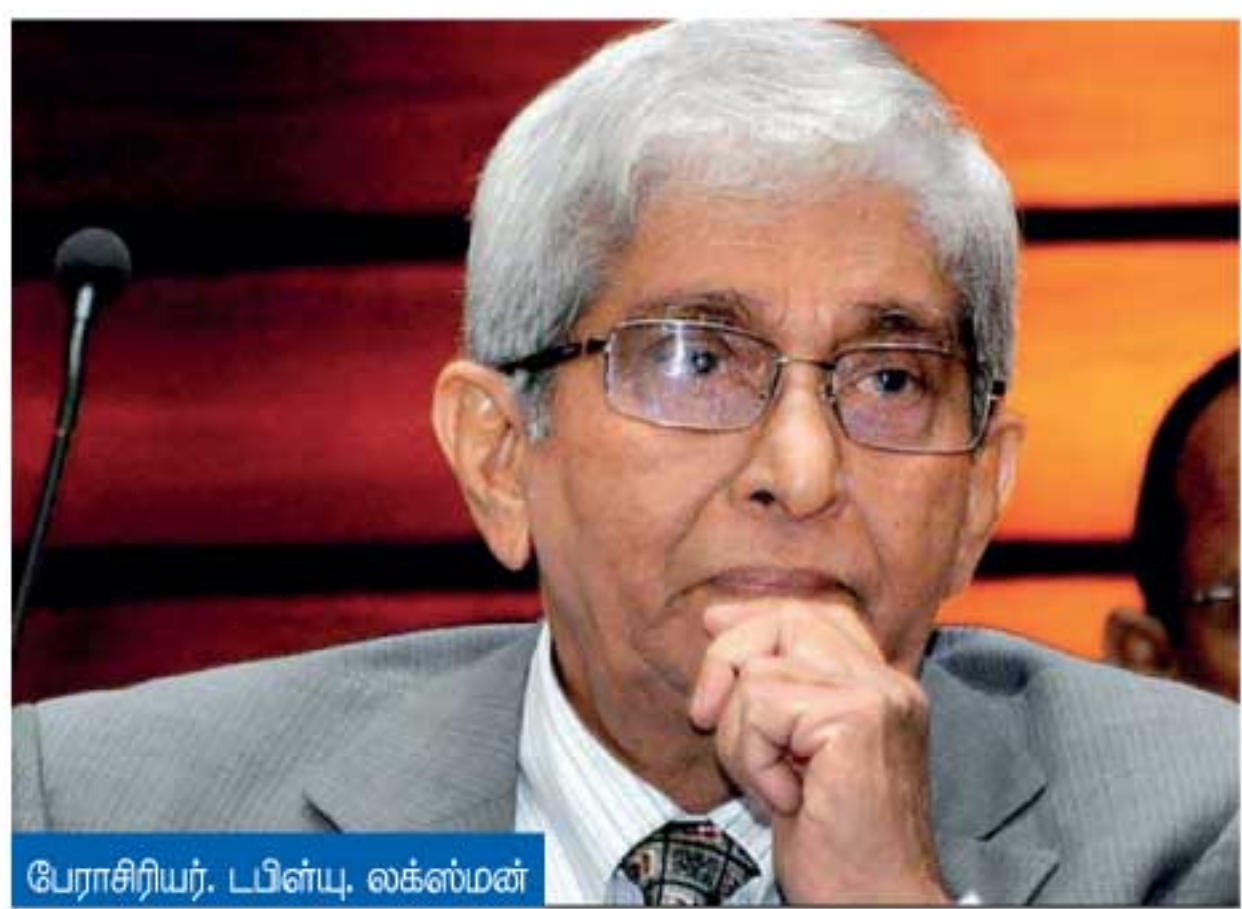
யோசிப்பர், டபிள்யூ. லக்ஸ்மன்

விட19- தொற்றுப் பரவல் இலங்கையில் இனங்காணப்பட்டது முதல் நாட்டுக்கு இறக்குமதி செய்யப்படும் பொருட்களுக்கு கட்டுப்பாடுகள் விதிக்கப்படுவது படிப்படியாக ஆரம்பமாகி தற்போதும் நீண்ட வண்ணமுள்ளது. ஆரம்பத்தில் வாகனங்கள், குளியலறை மற்றும் கழிவறை சாதனங்கள், தரைஓடுகள், மஞ்சள், உரம் போன்ற பொருட்கள் இவ்வாறானதைக் கட்டுப்படுத்தப்பட்டிருந்தன. சில பொருட்களின் இறக்குமதித் தடைக்கு உள்நாட்டு உற்பத்தி பாதிக்கப்படுவது தொடர்பில் மாற்றுக் கருத்து தெரிவிக்கப்பட்டிருந்தது. சில பொருட்கள் இறக்குமதி காரணமாக அந்நியச் செலாவணி இருப்புக்கு நெருக்கடிக்கு முகங்கொடுக்க வேண்டி ஏற்படும் என காரணம் தெரிவிக்கப்பட்டது. கடந்த வாரத்தின் பிற்பகுதியிலும் மேலும் 623 பொருட்கள் இறக்குமதிக்கு கட்டுப்பாடுகள் விதிக்கப்பட்டுள்ளன. அதாவது, பொருட்களை இறக்குமதி செய்கையில் குறிப்பிட்ட காலப்பகுதியில் மீள் செலுத்துவது எனும் புரிந்துணர்வின் அடிப்படையில் வங்கியிடமிருந்து கடன் கடிதம் (LC) திறக்கப்பட்டு, பின்னர் அதை குறித்த இறக்குமதியாளர் மீள் செலுத்துவார். இது பெரும்பாலும் குறித்த வாடிக்கையாளருக்கும், வங்கிக்குமிடையே காணப்படும் நல்லுறவின் அடிப்படையில் தீர்மானிக்கப்படும். இதுவரை காலமும் இந்த வழமை பின்பற்றப்பட்டு வந்தது.