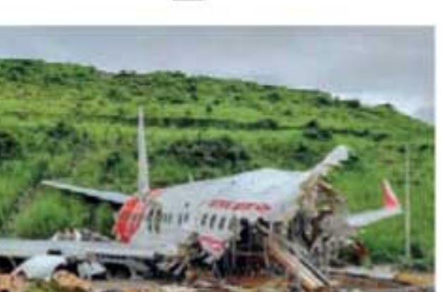
விபத்து குறித்து 'விமான விபத்துக்கான விசாரணை அமைப்பு' நடத்திய விசாரணை முடிவுக்கு வந்து அந்த விசாரணை அறிக்கை நேற்று முன்தினம் வெளியானது.

ஐக்கிய அரபு அமீரகத்தில் இருந்து கோளாவின் திருவனந்தபுரம் விமான நிலையத்திற்கு 190 பயணிகளுடன் 2020 ஆண்டு ஓகஸ்ட் 7ஆம் திகதியன்று வந்த ஏர் இந்தியா விமானம் விமானம் விமான நிலையத்தில் தரையிறங்கிய போது விபத்துக்குள்ளானது. விமானம் ஓடுதளத்தை விட்டு விலகி பள்ளத்தில் விழுந்து இரண்டாக உடைந்து விபத்துக்குள்ளானது. இந்த விபத்தில் விமானத்தில் பயணம் செய்தவர்களில் 2 விமானிகள் உள்பட 21 பேர் உயிரிழந்தனர். இந்நிலையில், கோழிக்கோடு விமான