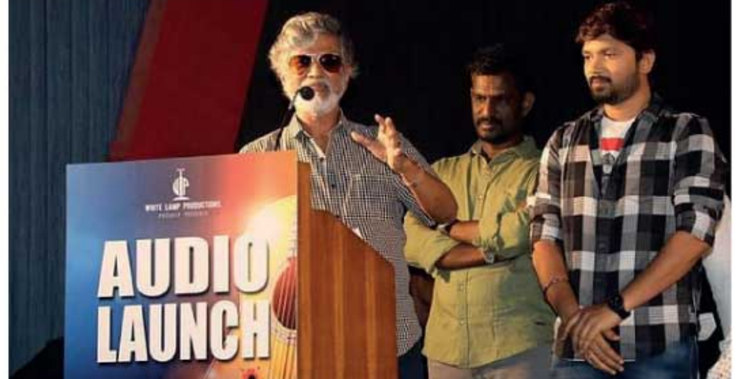
அதற்கு முரணாக ஊடகங்கள் இப்போது செயல்படுகின்றன.