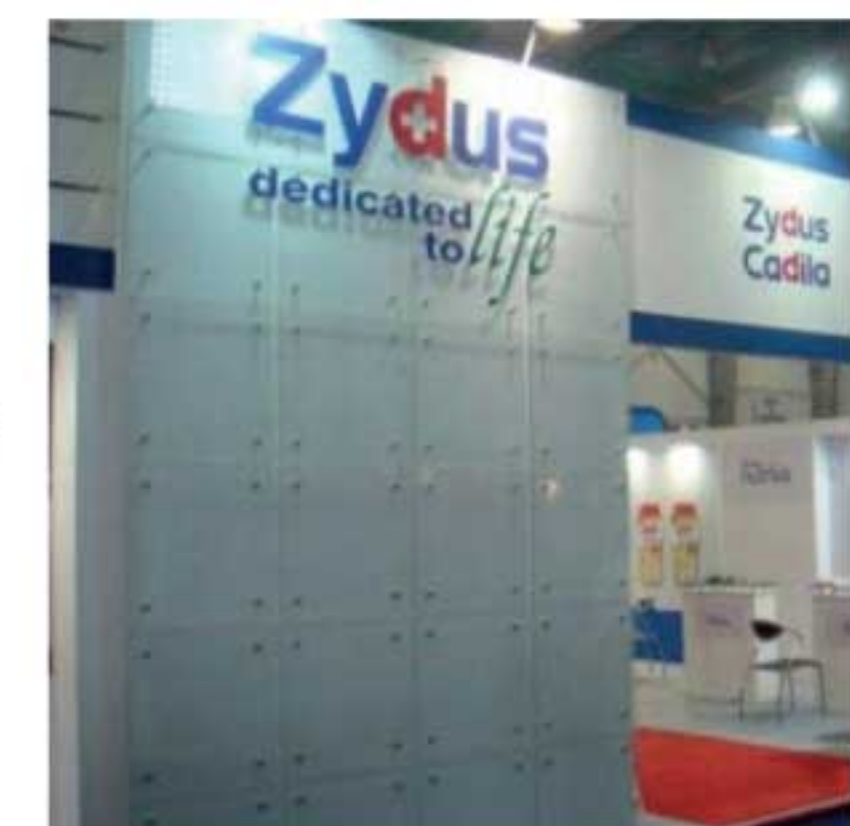
தடுப்பூசியாகும். கொரோனா வைரஸுக்குத் தடுப்பூசி இதுவரை கண்டுபிடிக்கப்படவில்லை. தடுப்பூசி தயாரிக்கப்பட்டுள்ளது. பிளாஸ்மா டிஎன்ஏ தடுப்பூசி என்பது ஐடல் கெடில்லா நிறுவனத்துடையது மட்டும்தான். கொரோனாவுக்கு எதிராக

ஐடல் கெடில்லா நிறுவனத்தின் 'ஊசியில்லா கொரோனா' தடுப்பூசியான ஐகோவ்-டி மருந்து ஒக்டோபர் முதல்வாரத்திலும் இந்தியாவில் அறிமுகமாகலாம் என நம்பத்தகுந்த வட்டாரங்கள் தெரிவிக்கின்றன என இந்தியச் செய்திகள் தெரிவிக்கின்றன. ஐடல் கெடில்லா நிறுவனம் தயாரித்துள்ள ஐகோவ்-டி தடுப்பூசியை அவசரகாலத்துக்குப் பயன்படுத்தக்கொள்ள கடந்த மாதம் 20 ஆம் திகதி இந்திய மருந்துக் கட்டுப்பாட்டு அமைப்பு அனுமதியளித்தது. ஐகோவ்-டி தடுப்பூசி உலகிலேயே முதன்முதலாக பிளாஸ்மா டிஎன்ஏ