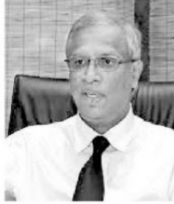
இணைந்து செயற்படுமே தவிர ஒருபோதும் தனித்து செயற்படாது.

அவ்வாறான ஒரு சம்பவம் இடம் பெறாது எந்த காலத்திலும் இலங்கை தமிழரசுக் கட்சியானது தமிழ் தேசியக் கூட்டமைப்பில் அங்கம் வகிக்கும் ஏனைய கட்சிகளுடன்