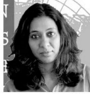
கண்காணிப்பகம் குறிப்பிட்ட உள்ளது. மேலும் தொடர்ச்சியான சர்வதேச கவனமும் அழுத்தமும்

நிறைவேற்றுவதற்கான அழுத்தத்தை கொடுக்க தங்கள் விருப்பத்தை மற்ற நாடுகள் வெளிப்படுத்த வேண்டும் என்றும் மனித உரிமைகள்