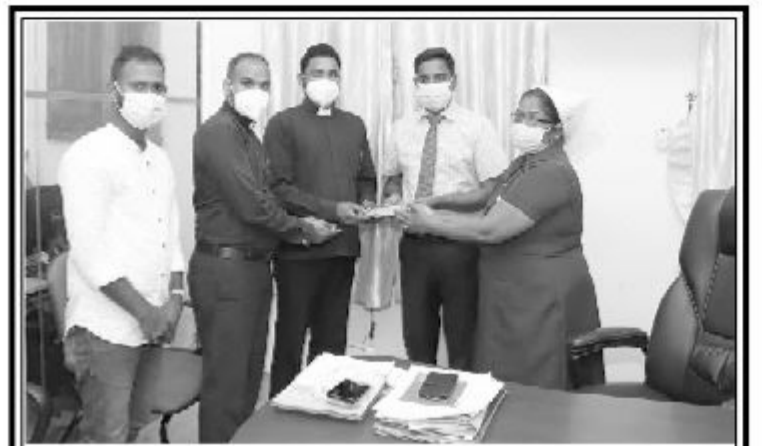
அசெம்பிளீஸ் ஒவ் கோட் ஒவ் சீலோனாவல் யாழ்ப்போதனா வைத்தியசாலையில் நோயாளர்கள் பராமரிப்புத் தேவைகளுக்காக ஒரு தொகைப்பணம் வைத்தியசாலை நிர்வாகத்தினரிடம் அண்மையில் கையளிக்கப்பட்டது.