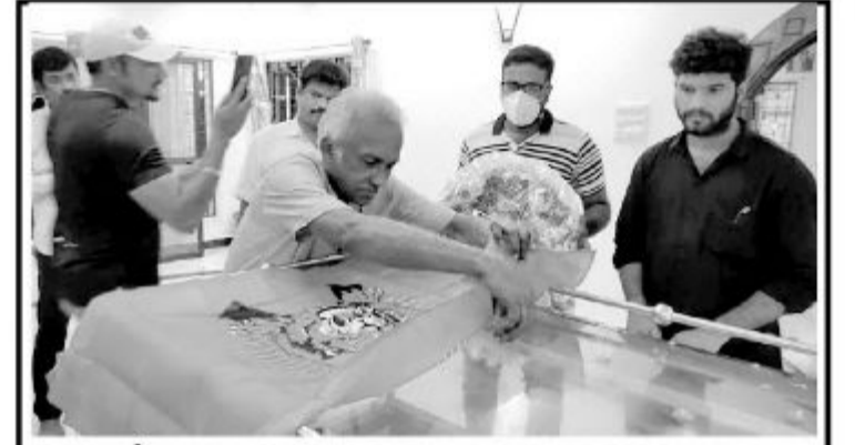
தமிழீழ விடுதலையுடைய புலிகளின் புகலிடமாக விளங்கிய புலவர் புலமைப்பித்தனுக்கு நாடு கடந்த அரசாங்கத்தால் புலிக்கொடி போர்த்தி உயரிய மரியாதை செய்யப்பட்டது.

ஈ.நா பொதுச் சபை அமர்வில் ஜனாதிபதி கோட்டாபய