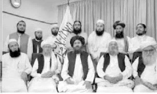
ஹசன் அகுந்த் மற்றும் பல அமைச்சர்களின் பெயர்கள், அமெரிக்காவின் சர்வதேச