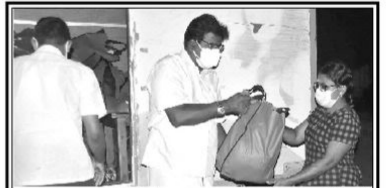
பள்ளி, பரந்தன், பிரமந்தனாறு, தருமபுரம், கணகாம்பிகைக்குளம் ஆகிய பகுதிகளிலிருந்து தெரிவு செய்யப்பட்ட 250 குடும்பங்களுக்கு கூந்த செவ்வாய்க்கிழமை தமிழ்தேசிய பசுமை இயக்கத்தினரால் உலருணவு பொதிகள் வழங்கி வைக்கப்பட்டன.

எனவே சம்மந்தப்பட்ட அதிகாரிகள் உடன் விரைந்து களப்பணி மேற்கொண்டு மணல் அகழ்வை தடுத்து நிறுத்துவதுடன் அம்பலவன்பொக்கணை பிரதேசத்தில் எதிர்காலத்தில் ஏற்பட இருக்கும் பாரிய அழிவையும் தடுத்து நிறுத்துவதுடன் குறித்த விடயத்திற்கு நிரந்தரமான தீர்வை பெற்றுத்தரும்படி பொதுமக்கள் வேண்டுகோள் விடுத்துள்ளனர். (7-4-350)