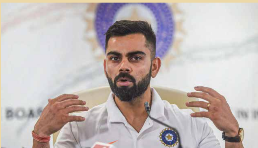
தொடர்ந்து நீடிப்பார் எனவும் தகவல்கள் கூறுகின்றன. ஒக்டோபர்-நவம்பர் மாதத்தில் நடைபெறும் ரி-20

அதேவேளையில், டெஸ்ட் மற்றும் ரி-20 போட்டிகளுக்கான அணித்தலைவர் பொறுப்பில் விராட் கோலி