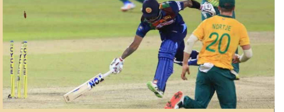
அணியின் வனிந்து ஹசரங்க வீழ்த்தப்பட்ட விகிதக்கெட்டுகளை கைப்பற்றியிருந்தார்.

குயின்ரன் டி கொக் 58 ஓட்டங்களையும் ஹெய்டன் மார்க்ரம் 21 ஓட்டங்களையும் ஆட்டமிழக்காது பெற்றுக் கொண்டனர். இலங்கை