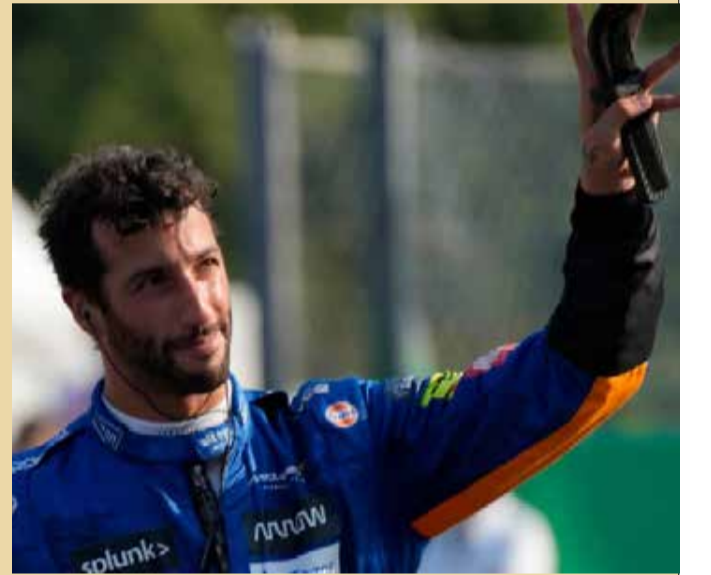
பிடித்தார். அவருக்கு 18 புள்ளிகள் வழங்கப்பட்டன.

4.921 வினாடிகள் பின்தங்கிய நிலையில் பந்தயத் தூரத்தைக் கடந்த, மெர்சிடஸ் பென்ஸ் அணியின் வீரரான வோல்ட்ஹெரி போட்டஸ் மூன்றாமிடத்தைப்