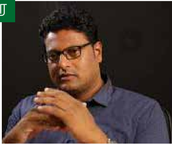
புரை வழங்கப்பட்டுள்ளதாக அறியக்கிடைத்தது.