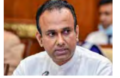
ணிக்கை குறைவடைந்துள்ளன” - என்றார். (இ)

டங்குச் சட்டம் எதிர்வரும் 21ஆம் திகதி அதிகாலை 4 மணி வரை அமுலில் இருக்கும். அதில் மாற்றம் இருப்பின் அது குறித்து அறிவிக்கப்படும். தனிமைப்படுத்தல் ஊரடங்கால் தொற்றாளர்களின் எண்ணிக்கை மற்றும் மரண எண்