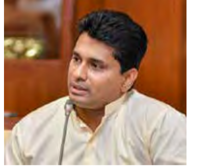
தொற்றா நோய்களால் பாதிக்கப்பட்ட நபர்களுக்குத் தடுப்பூசி செலுத்தும் பணிகளை இன்னும் சில தினங்களில் நிறைவு செய்ய முடியும்” எனவும் அவர் மேலும் கூறினார். (இ)

போது குறைவடைகின்றன. இந்நிலையில், ஊரடங்கைத் தளர்த்துவது தொடர்பிலேயே அரசு கவனம் செலுத்தியுள்ளது” எனவும் அவர் சுட்டிக்காட்டினார். “60 வயதுக்கு மேற்பட்ட