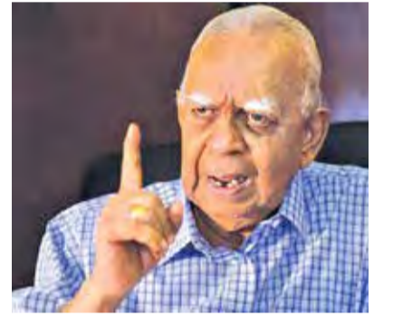
துரைகளையும், ஐ.நா. மனித உரிமைகள் ஆணையாளர் மிச்செல் பச்செலட் அம்மையாரின் கோரிக்கைகளையும் இலங்கை அரசு நிறைவேற்றியே தீர் வேண்டும் எனவும் அவர் வலியுறுத்தினார். (இ)

கொழும்பு, செப்.15 பொய்யான வாக்குறுதிகளை வழங்கி ஐ.நாவையும் சர்வதேச சமூகத்தையும் ஏமாற்றலாம் என்று இலங்கை அரசு இனியும் எண்ணக்கூடாது எனத் தமிழ்த் தேசியக் கூட்டமைப்பின் தலைவர் இரா.சம்பந்தன் தெரிவித்தார்.