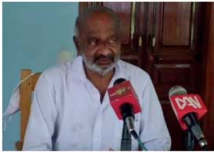
என்பது இதுவே முதல் நடவடிக்கையும் எனவும் கூறினார். தொடர்ச்சி P2