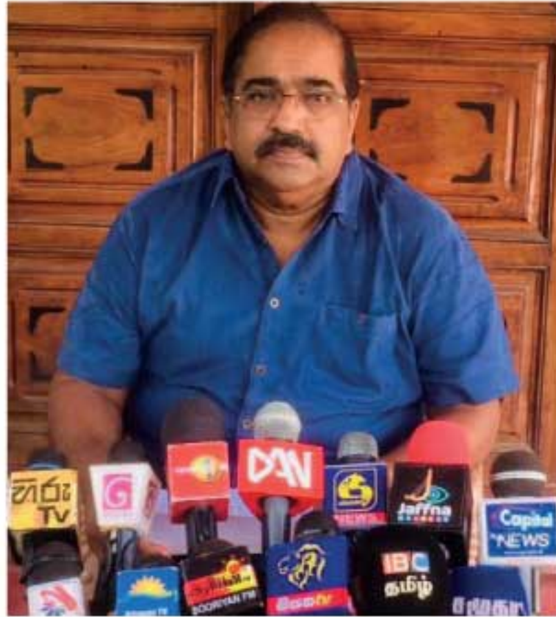
அவர், துப்பாக்கியுடன் சிறைச்சாலைக்குச் சென்ற இராஜாங்க அமைச்சர் தனியாக செல்லாது, தனது நண்பர்களுடன் சென்று இருக்கின்றார் எனவும் கூறினார்.

அதிகாரிகளாக இருந்தாலும் சரி, சிறைச்சாலைக்குள் அங்கிகாரம் அளிக்கப்பட்டோரைத் தவிர, அரசியல்வாதிகளோ எந்தவோர் அதிகாரியோ துப்பாக்கியுடன் சிறைச்சாலைக்குள் நுழைய அனுமதித்தது தவறாகும். சிறைச்சாலைகள் விருந்தினர் விடுதி அல்ல எனத் தெரிவித்த