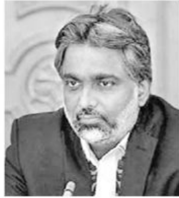
அமைச்சர்கள் மற்றும் அதிகாரிகளை மாற்றுவதன் மூலம் பிரச்சினைகளுக்கு தீவு காண முடியாது என மேலும் தெரிவித்தார்.(7-5)

தொற்று நோய் பரவலும் சந்தர்ப்பத்தில் தேர்தலை நடத்த வேண்டும் எனக் கூறிய எதிர்க்கட்சித் தலைவரின் மூளையை பரிசோதிக்க வேண்டும்.