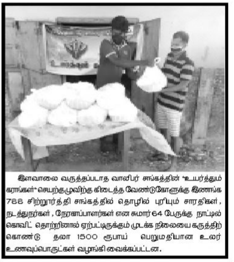
இளவாலை வருத்தப்படாத வாலிபர் சங்கத்தின் 'உயர்த்தும் கரங்கள்' செயற்புழவிற் கடைத்த வேண்டுகோளுக்கு இணங்க 788 சிறுநூர்த்தி சங்கத்தில் தொழில் புரியும் சாரதிகள், நடத்துநர்கள், நேரகாப்பாளர்கள் என சுமார் 64 பேருக்கு நாட்டில் கொவிட் தொற்றினால் ஏற்பட்டிருக்கும் முடக்க நிலையை கருத்திற் கொண்டு தலா 1500 ரூபாய் பெறுமதியான உலர் உணவுப்பொருட்கள் வழங்கிவைக்கப்பட்டன.

இந்த கொரோனா நோயின் தாக்கமானது கல்வி சுகாதாரம், பொருளாதாரம் ஆகிய அனைத்து விடயங்களிலும் தாக்கத்தை ஏற்படுத்தியுள்ளது இது இலங்கையில் மட்டுமல்ல உலகமளவிய ரீதியில் பாதிப்பை ஏற்படுத்தியுள்ளது. உலகத்தில் உள்ள மக்கள் இந்த நோயிலிருந்து விடுபட வேண்டும். மக்கள் துன்பத்தில் இருந்து விடுபட வேண்டியே இந்த விசேட பூசை வழிபாட்டினை ஏற்பாடு செய்துள்ளோம் அரசியல் இன மத வேறுபாடு இன்றி அனைத்து மக்களும் நோயிலிருந்து விடுபட வேண்டியே இந்த வழிபாட்டினை மேற்கொண்டுள்ளோம். குறித்த வழிபாட்டின் மூலம் மக்களுக்கு நன்மை கிடைக்கும் என நம்புவதாக தெரிவித்தார். (7-5-6-33)