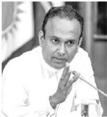
(கொழும்பு) தனிமைப்படுத்தல் ஊரடங்கை உத்தர

வின் விளைவாக கொரோனா இறப்புகளின் எண்ணிக்கை குறைந்துள்ளதாக அரசாங்கம் தெரிவித்துள்ளது. நேற்று நடைபெற்ற அமைச்சரவை செய்தியாளர் சந்திப்பில் எழுப்பப்பட்ட கேள்விக்கு பதிலளிக்கும்போதே அமைச்சரவை இணை செய்தித் தொடர்பாளர் அமைச்சர் ரமேஷ் பத்திரண இதனைத் தெரிவித்தார். இந்த நிலையில், எதிர்வரும் வாரம் ஊரடங்கை உத்தரவு நீக்கப்படும் என எதிர்பார்க்கப்படுவதாக அவர் தெரிவித்தார். எவ்வாறாயினும் கொரோனா பணிக் குழு பரிசீலனை செய்த பின்னரே இந்த விடயத்தில் இறுதி முடிவு எடுக்கப்படும் என்றும் அவர் தெரிவித்தார். (நி-5)