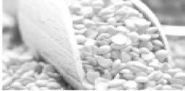
சந்தையில் பருப்பின் விலையானது தற்போது 250 ரூபாய் வரையில் அதிகரித்துள்ளதாக அந்த

இலங்கையில் பருப்பின் விலை மேலும் அதிகரிக்கக்கூடும் என அத்தியாவசிய பொருட்களின் இறக்குமதியாளர்கள் மற்றும் விற்பனையாளர்கள் சங்கம் தெரிவித்துள்ளது.