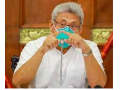
தாரக் கட்டுப்பாடுகளுடன் நாடு திறக்கப்படலாம் எனவும், மாகாணங்களுக்கிடையிலான பயணத்தைத் தொடரும் எனவும் தெரியவருகின்றது. (இ)

கொழும்பு, செப். 17 நாட்டில் தற்போது அமுலில் உள்ள தனிமைப்படுத்தல் ஊரடங்குச் சட்டத்தை எதிர்வரும் 21ஆம் திகதிக்கு பின்னரும் நீடிப்பதா அல்லது தளர்த்தப்படுமா என்பது குறித்து இன்று தீர்மானம் எடுக்கப்படவுள்ளது.