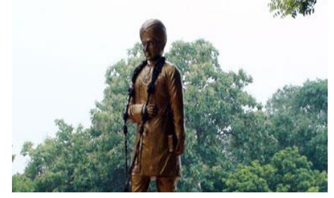
யாழ்ப்பாணப் பல்கலைக்கழகத்தில் நிறுவப்பட்டுள்ள சேர் பொன் இராமநாதன் அவர்களின் உருவச்சிலை.

அந்த விழாவின்போது பிரித்தானியா அரசினால் இலங்கையின் முழுமையான தேசியவாதி என்னும் கௌரவமும் தங்கப்பதக்கமும் வழங்கிக் கௌரவிக்கப்பட்டார். 1911 ம் ஆண்டு நடைபெற்ற இலங்கையின் சட்டசபைக்கான முதலாவது தேர்தலில் முழு இலங்கையரையும் பிரதிநிதித்துவப்படுத்தும் ஒரே உறுப்பினராக இராமநாதன் தெரிவு செய்யப்பட்டமையானது தமிழ் பேசும் மக்கள் அனைவரையும் மெய்சிலிர்த்து வைத்தது. அத்துடன் 1921 ம் ஆண்டு பிரித்தானியா அரசினால் இவருக்கு இன்னுமொரு கௌரவம் அளிக்கப்பட்டது. அதுவரை காலமும் பிரித்தானியர்களுக்கு மாத்திரமே வழங்கப்பட்டு வந்த பிரபு பட்டம் (Sir) பிரித்தானியா அரசினால் இராமநாதன் அவர்களுக்கு வழங்கப்பட்டது. இராமநாதன் அவர்கள் இயல்பாகவே சொல்வன்மையும் வாதத் திறமையும் மிக்கவராக விளங்கினார்.