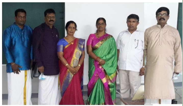
Tournament organizers with referees.

The first round of "Bharatiyar Songs" has 61 students in this round About 10 teachers were selected for the next round.