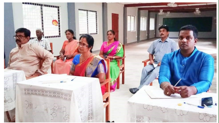
The President and the Referees in the process of selecting the contestants from the second round.

The president and the Referees in the process of selecting the contestants from the first round. The 10 contestants who were selected for the second round of "Country Songs" are participated in the competition through the online system.