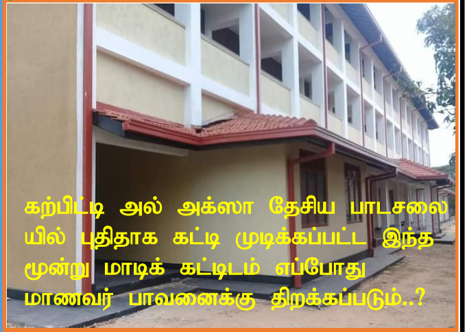
கற்பிட்டி அல் அக்ஸா தேசிய பாடசலையில் புதிதாக கட்டி முடிக்கப்பட்ட இந்த மூன்று மாடிக் கட்டிடம் எப்போது மாணவர் பாவனைக்கு திறக்கப்படும்..?

இக் கட்டிட உடனப்பிற்கான கேள்விப்பத்திரம் எப்போது கோரப்படும்..?