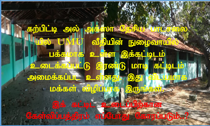
கற்பிட்டி அல் அக்ஸா தேசிய பாடசலையில் UMU வீதியின் நுழைவாயில் பக்கமாக உள்ள இக்கட்டிடம் உடைக்கப்பட்டு இரண்டு மாடி கட்டிடம் அமைக்கப்பட உள்ளது. இது விடயமாக மக்கள் விழிப்பாக இருங்கள்.

இக் கட்டிட உடனப்பிற்கான கேள்விப்பத்திரம் எப்போது கோரப்படும்..?