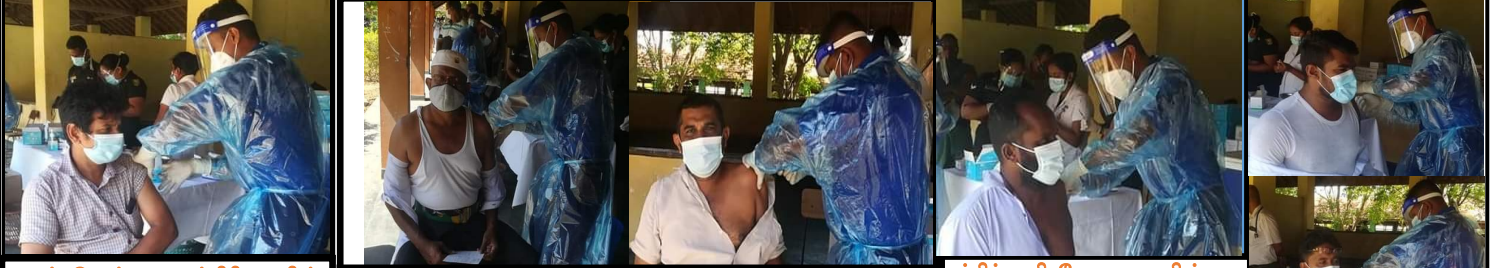
கருப்புவெள்ளை பத்திரிகையின் பிரதம ஆசிரியர்