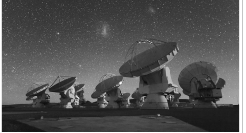
சிலியில் உள்ள அட்டகாமா (Atacama) பாலைவனத்தில் உள்ள தொலைநோக்கிகள்

பென்குயின் போன்ற உயிரினங்களின் குடல் நாளத்தில் வசிக்கும் நண்ணுயிர்கள், ஓட்சிசன் அளவு மிகவும் குறைவாக இருக்கும் உயிர்ச்சூழல் ஆகியவற்றில் வாழும் உயிரினங்கள் ஆகியவற்றால் இந்த