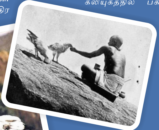
கழுக்குகள் அழுது செய்யும் காட்சி

அதற்குச் சிவபெருமான் மூன்று கைப்பிடி மண்ணை எடுத்து, 3 மலைகளைத் தோற்றுவித்தார். மேலும், 'பரத்துவாசரே! நீ படிக்க வேண்டிய வேதம் இந்த 3 கைபிடி அளவு மண்களும் தான். எவ்வளவு காலம் வாழ்ந்து இடைவிடாது படித்தாலும், மோட்சத்துக்கான மூலத்தை நீ காண முடியாது. கலியுகத்தில் பக்தி