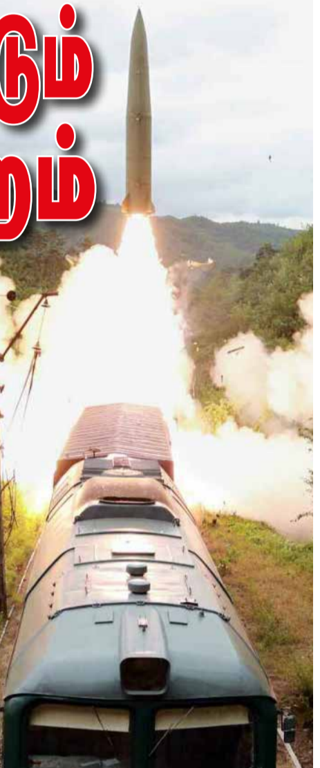
வடகொரியா, தண்டவாளத்தில் நிறுத்திவைக்கப்பட்ட ரயிலின் கூரையிலிருந்து ஏவுகணை ஏவி வெற்றிகரமாக பரிசோதித்துள்ளது. அந்த ஏவுகணை சுமார் 800 கிலோ மீற்றர் தொலைவுக்கு பாய்ந்து வட கொரியாவின் கிழக்கு கடல் பகுதியிலிருந்து இலக்கை தாக்கியதாக தெரிவிக்கப்பட்டுள்ளது.