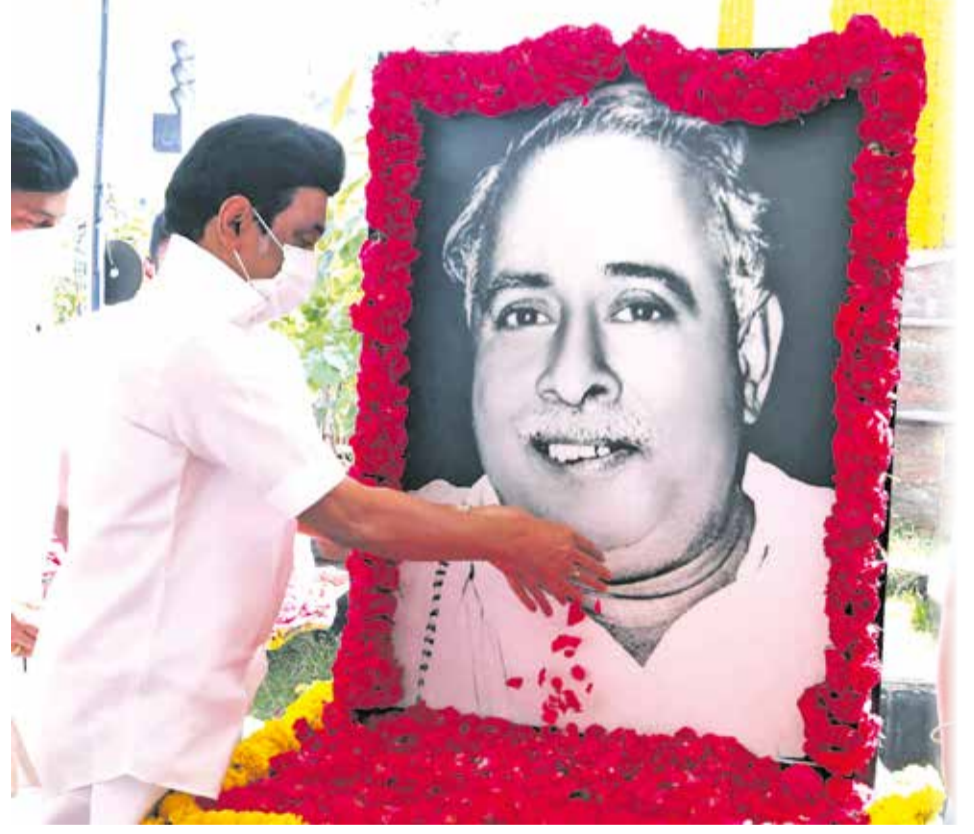
பேரறிஞர் அண்ணாவின் 113ஆவது பிறந்தநாளையொட்டி சென்னை அண்ணா சாலையிலுள்ள, அண்ணா சிலைக்கு தி.மு.க. தலைவரும், தமிழக முதலமைச்சருமான மு.க.ஸ்டாலின் மாலை அணிவித்து மரியாதை செலுத்தியபின்னர், அங்கிருந்து வள்ளுவர் கோட்டம் சென்று, அங்குள்ள அண்ணா சிலைக்கு மலர் தூவி மரியாதை செலுத்தியபோது...

சீன ஆதிக்கத்தை கட்டுப்படுத்த... பாதுகாப்பு கூட்டணியமைக்கும் அமெரிக்கா - பிரிட்டன் - ஆஸி. இந்தோ - பசுபிக் கடல் பகுதியில் சீனாவின் அதிகாரத்தைக் கட்டுக்குள் கொண்டு வர அமெரிக்கா, பிரித்தானியா, அவுஸ்திரேலியா ஆகிய மூன்று நாடுகள் பாதுகாப்பு கூட்டணி அமைத்துள்ளதாக அமெரிக்க ஜனாதிபதி ஜோ பைடன் அறிவித்துள்ளார். பிரித்தானியா மற்றும் அவுஸ்திரேலிய பிரதமர்களுடன் ஜோ பைடன் இணைந்து வெளியிட்ட கூட்டறிக்கையில், 'AUKUS' என்ற இந்தப் புதிய கூட்டணி இந்தோ-பசுபிக்கை பாதுகாப்பான பிரதேசமாக மாற்றும் என்று உறுதியளிக்கப்பட்டுள்ளது. அவுஸ்திரேலியாவுக்கு அணு-ஆயுதம் தாங்கி நீர்மூழ்கி கப்பல் படையை உருவாக்குவது இக்கூட்டணியின் முதல் செயற்றிட்டமாகவுள்ளது.