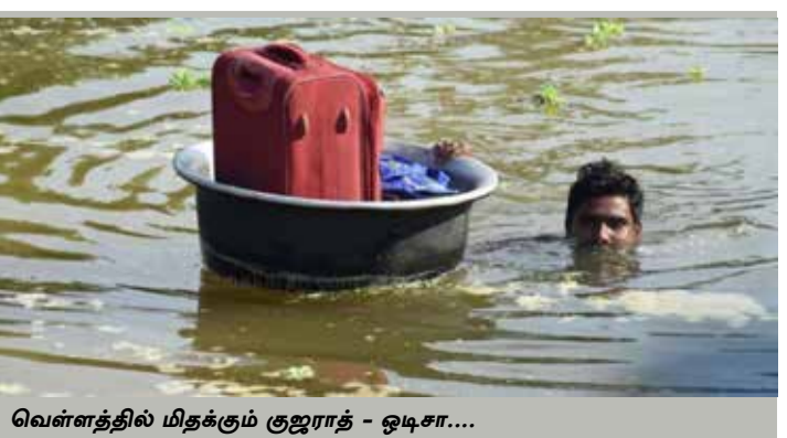
வெள்ளத்தில் மிதக்கும் குஜராத் - ஒடிசா...

உள்ளூராட்சித் தேர்தலில் மக்கள் நீதி மய்யம் தனித்துப் போட்டியிடவுள்ளதாக அக்கட்சியின் தலைவர் கமல்ஹாசன் அறிவித்துள்ளார். இது தொடர்பாக அவர் வெளியிட்டுள்ள உட்காட்சி பதிவில், உள்ளூராட்சித் தேர்தல் நடைபெறவுள்ள 9 மாவட்டங்களிலும் பரப்புரைப் பயணம் மேற்கொள்ளவிருப்பதாக குறிப்பிட்டுள்ளார். "களத்தில் சந்திப்போம், வெற்றி நமதே" எனவும் குறிப்பிட்டுள்ளார்.