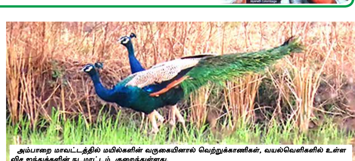
அம்பாறை மாவட்டத்தில் மயில்களின் வருகையினால் வெற்றுக்காணிகள், வயல்வெளிகளில் உள்ள விச ஜந்துக்களின் நடமாட்டம் குறைந்துள்ளது.