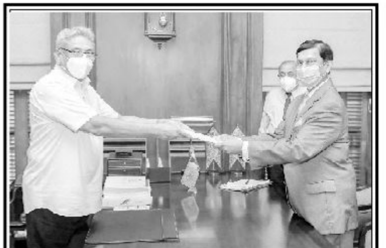
இலங்கை மத்திய வங்கியின் 16 ஆவது ஆளுநராக நியமிக்கப்பட்டுள்ள அஜித் நிவாட் கப்ரால் நேற்று முற்பகல் ஜனாதிபதி அவ்வகைத்தில் வைத்து ஜனாதிபதி கோட்டாபய ராஜபக்ஷவிடமிருந்து தனது நியமனக் கடிதத்தைப் பெற்றுக் கொண்டார்.

சிறைக்கைதிகள் தவறான முறையில் நடத்தப்படுவதை வன்மையாகக் கண்டிப்பதாக தெரிவித்துள்ள அவர், தேசத்தின் கடமை கைதிகளின் உரிமைகளைப் பாதுகாப்பது என்றும் அவர் தனது ருவிட்டரில் பதிவிடும் மேலும் தெரிவித்துள்ளார். (நி-5)